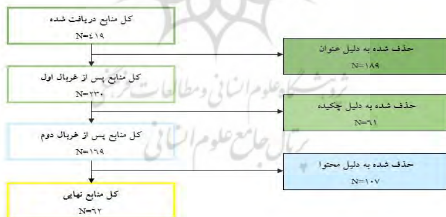
شکل ۴. الگوریتم انتخاب منابع نهایی

در انجام این غربالگری ابزار برنامه مهارت‌های ارزیابی حیاتی ابزاری کمک شایانی به بررسی کیفیت مقالات کرد.