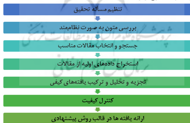
شکل ۳. فرآیند هفت مرحله‌ای فراترکیب

در این مقاله به منظور شناسایی ابعاد و مؤلفه‌های فرهنگ دانشگاهی و ارائه مدل، از روش کیفی فراترکیب استفاده شده است. بدین منظور محقق با استفاده از روش فراترکیب به استخراج مقولات و مفاهیم مربوط به فرهنگ دانشگاهی از طریق مرور نظام‌مند ادبیات موجود پرداخته و مدل پیشنهادی خود را ارائه می‌دهد. روش فراترکیب از انواع مختلف راهبردهای تحقیق کیفی است. این روش رویکردی نظام‌مند برای محققان فراهم می‌کند تا تحقیقات را ترکیب کرده و تم‌ها و استعاره‌های پنهان را شناسایی کنند و از این طریق دانش موجود را توسعه و دیدی جامع و گسترده‌ای ایجاد کنند (سایو و لانگ، ۲۰۰۵، ۱). از شناخته‌شده‌ترین الگوهای پیاده‌سازی روش فراترکیب که بیشترین استفاده را دارد، الگوی هفت مرحله‌ای ساندلوسکی و باروسو ۱ (۲۰۰۷) است. در پژوهش حاضر نیز این الگو به کار گرفته شده که مراحل انجام روش فراترکیب در این الگو به شرح زیر است: