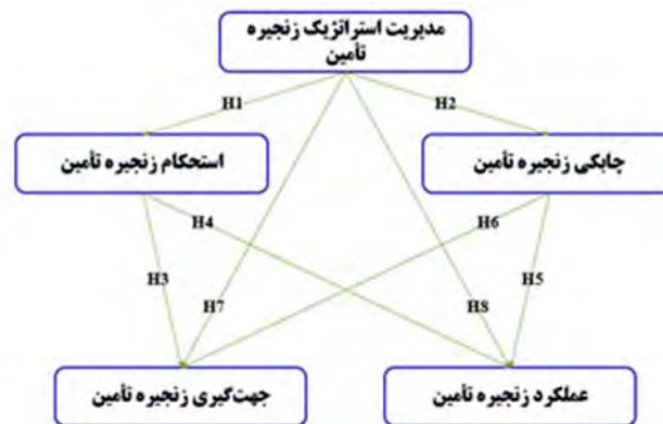
شکل ۱. مدل ساختاری تحقیق