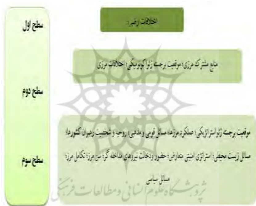
شکل ۱. سطح بندی عوامل مؤثر بر اختلافات مرزی در منطقه ژئوپلیتیکی آسیای

و منطقه‌ای بکوشند تا با تاکید بر منافع خود به طور مستقیم و یا با اتخاذ یک استراتژی غیرمستقیم، برای تأثیر گذاشتن بر کشورها داشته باشند. در نهایت کشورهای آسیای مرکزی (قزاقستان، قرقیزستان، ترکمنستان، تاجیکستان و ازبکستان) با چالش‌های امنیتی مشترکی مثل جنایت، فساد، تروریسم، آلودگی زیست محیطی، دخالت‌های قدرت‌های منطقه‌ای و فرامنطقه‌ای، اختلافات نژادی قومی و وجود گروه‌های تندروی مذهبی مواجهه بوده و در زمینه اجرای تعهدات خود برای اصلاحات اقتصادی و دموکراتیک با مشکلات فراوانی مواجه هستند.