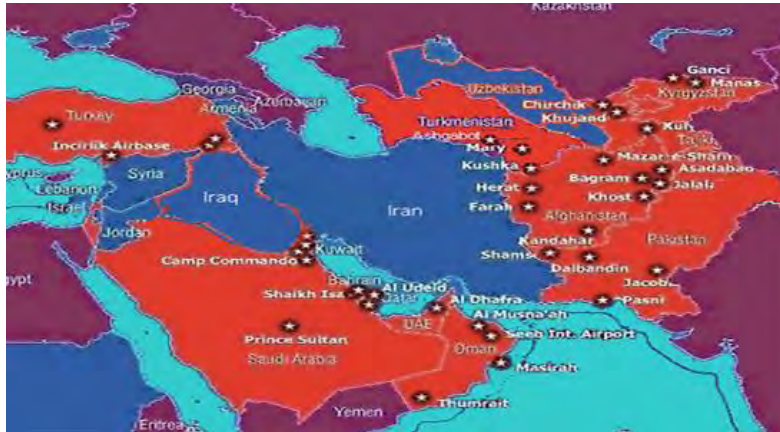
شکل شماره ۳. پایگاه‌های نظامی آمریکا مستقر در اطراف ایران ۱

در چارچوب به کارگیری نیروهای نظامی متعارف، به مثابه یکی از مؤلفه‌های اصلی جنگ هیبریدی، علاوه بر پایگاه‌های نظامی، می‌توان از به کارگیری ائتلاف‌های منطقه‌ای توسط ایالات متحده آمریکا علیه جمهوری اسلامی ایران نیز نام برد. یکی از مهم‌ترین این ائتلاف‌ها شورای همکاری خلیج فارس با حضور عربستان، عراق، قطر، کویت، امارات و عمان است. علاوه بر این می‌توان به تلاش‌هایی مبنی بر شکل‌گیری «ناتوی عربی» از سوی ایالات متحده با حضور کشورهای عرب منطقه‌ای نیز اشاره نمود. «نفوذ ایران در عراق و سوریه و همچنین تغییر معادلات منطقه‌ای به ضرر کشورهای عضو شورای همکاری خلیج فارس و دیگر کشورهای عرب منطقه و نیز توانایی ایران در ساخت و پرتاب موشک‌های بالستیک» (ورزی، ۱۳۹۷: ۵۰) سبب شد تا ایالات متحده آمریکا، در دوره ترامپ، تلاش‌های گسترده‌ای به منظور شکل‌گیری یک نوع ائتلاف در قالب «ناتوی عربی» آغاز نماید.