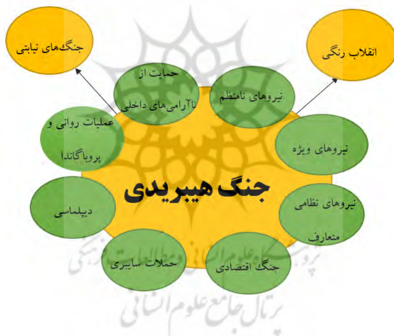
شکل شماره ۲. مؤلفه‌های جنگ ترکیبی ۱

مهم‌ترین مؤلفه‌های جنگ هیبریدی شامل نیروهای نامنظم و ویژه، حمایت از ناآرامی‌های داخلی، جنگ اطلاعاتی و پروپاگاندا، دیپلماسی، حملات سایبری، جنگ اقتصادی، نیروهای نظامی متعارف، نیروهای نظامی ویژه می‌باشد که در گزارش امنیتی مونیخ در سال ۲۰۱۵ آمده است. (Munich Security Report, 2015: 35) علاوه بر این می‌توان از انقلاب رنگی و جنگ نیابتی نیز به عنوان مؤلفه‌های دیگر جنگ هیبریدی نام برد.