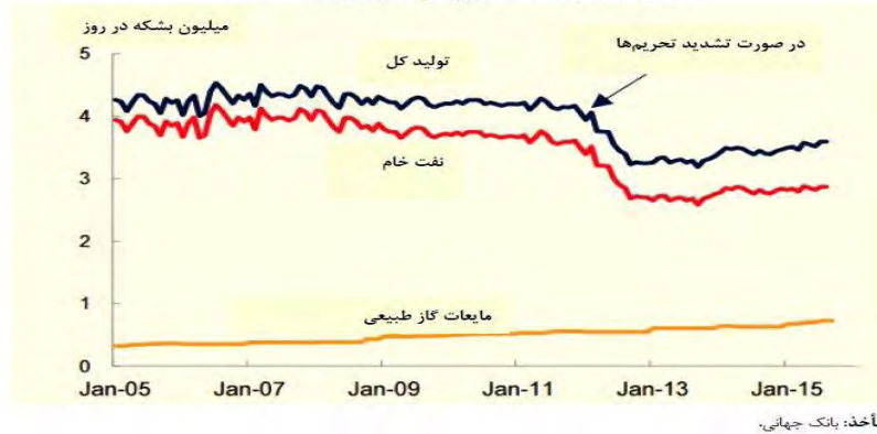
نمودار ۱. تولید نفت ایران طی سال‌های ۲۰۰۵-۲۰۱۵