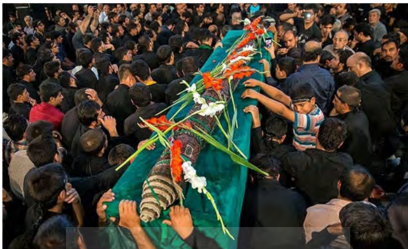
تصویر ۴: بُعد حسی و عاطفی قالی به‌مثابه اثر هنری. مردم به‌عنوان تابوت و پیکر مطهر امامزاده قالی را زیارت می‌کنند (URL3).

حسی قالی به‌عنوان اثر هنری تبیین می‌شود (تصویر ۳).