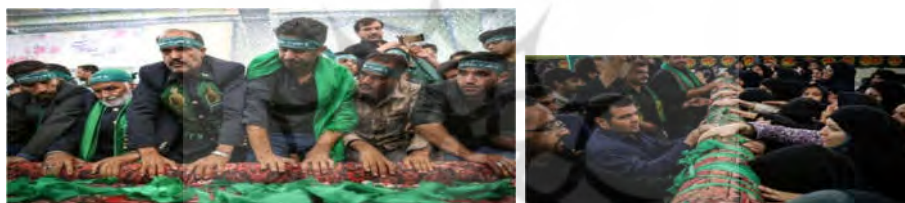
تصویر ۳ الف و ب: عاملیت فیزیکی قالی؛ تبرک جستن و طلب حاجات (URL2)

می‌رسد در مناسک قالی شویان مشهد اردهال، قالی به‌عنوان شیء هنری حامل نشانه است که معنا را انتقال می‌دهد و عاملیت دارد. از منظر انسان‌شناسی هنر میان دو بُعد معناشناختی و زیباشناختی قالی (شیء هنری) برای حاضرین در مراسم، وجه کارکردی منظور نظر است. بنا بر نظریهٔ جل قالی در بستر اجتماعی - ارتباطی مراسم قرار گرفته، تولید معنا می‌کند؛ قالی به‌مثابهٔ پیکر مطهر امامزاده سلطان‌علی یا تابوت ایشان بر روی دست و دوش مردم به حرکت درمی‌آید. بسیاری برای شفایابی و طلب حاجات نوارهای سبزرنگ را متبرک می‌کنند (تصویر ۳ الف و ب). قالی در واقع نمادی است که بار معنایی مناسک را بر دوش می‌کشد. «وقتی نماد آنقدر اهمیت می‌یابد که در بین اشکال مجموعه جایی برایش در نظر گرفته شود، می‌تواند کل اشکال داخل صحنه را تحت پوشش کامل قرار دهد» (بوآس، ۱۳۹۱: ۱۴۴) پس از پایان مراسم، قالی به تولیت بقعه متبرکه تحویل می‌گردد تا به‌عنوان نمادی آیینی حفظ و نگاهداری شود.