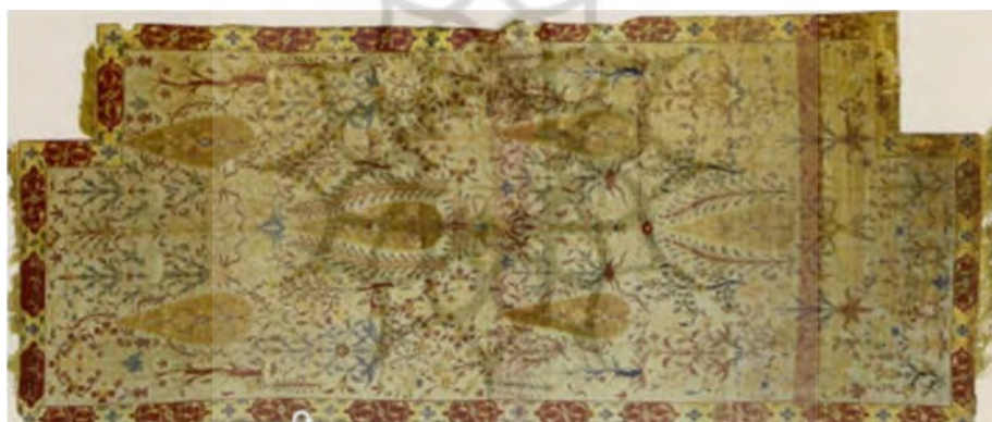
تصویر ۲: قالی مقبره شاه عباس دوم در موزه آستان حضرت معصومه (س)، اثر استاد نعمت الله جوشقانی، ابعاد ۸۵ در ۱۱۸ سانتی متر (پوپ و آکرمن، ۱۳۸۷: ج ۱۲، ۱۲۵۸)

بُعد عاملیتی: شاید دو بُعد معناشناختی و عاملیتی، قابلیت مطالعه بیشتری نسبت به ابعاد دیگر داشته باشند. آلفرد چل از متقدمان نظریه بُعد عاملیتی، شیء هنری را همچون اشخاص در نظر می گیرد که بر اساس آن اشیاء هنری، در جایگاه کنشگران (عاملان) اجتماعی قرار می گیرند. درباره ماهیت شیء هنری پیشاپیش نمی توان تصمیم گرفت، زیرا این نظریه بر این اندیشه مبتنی است که ماهیت شیء هنری، کارکرد شبکه اجتماعی - ارتباطی است که شیء هنری در آن قرار می گیرد؛ شیء هنری مستقل از زمینه ارتباطی، فاقد ماهیتی ذاتی است» (جل، ۱۳۹۰: ۳۱). به نظر