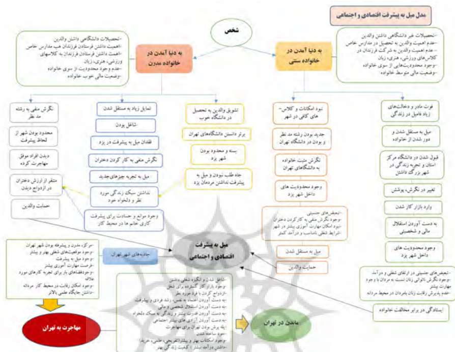
شکل ۲. مدل فرایندی میل به پیشرفت اقتصادی و اجتماعی