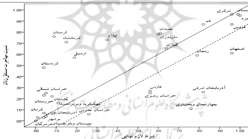
نمودار ۱: وضعیت عضویت استان‌ها (کل نمونه) در اشتراک فازی دو شرط علی توسعه اقتصادی- اجتماعی و توسعه تکنولوژیک

همچنین نتایج تحلیل فازی نشان می‌دهد که بیشترین نسبت مهاجرت مستقل زنان به شهر تهران از استان‌هایی بوده که بیشترین سطح توسعه‌یافتگی را دارند. بنابراین از بین استان‌های این خوشه (مرکزی، یزد و سمنان)، به دلیل این که محققین دسترسی بیشتری به مهاجرین استان یزد در