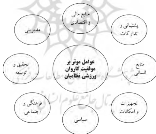
شکل ۲. مدل شماتیک عوامل مؤثر بر کامیابی کاروان ورزشی نظامیان جمهوری اسلامی ایران

در پایان این بخش و به‌عنوان جمع‌بندی یافته‌های پژوهش، مدل شماتیک عوامل مؤثر بر موفقیت کاروان ورزشی نظامیان جمهوری اسلامی ایران در شکل (۲) ارائه شده است.