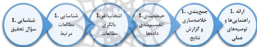
شکل ۱. مراحل انجام مطالعه براساس چارچوب آرسکی و اومالی

برای انجام مطالعات مرور حیطه‌ای پروتکل‌های مختلفی ارائه شده است که برای انجام پژوهش حاضر از چارچوب آرسکی و اومالی ۱ استفاده شد. این چارچوب شش گام دارد که در شکل زیر ارائه شده است (آرسکی و اومالی، ۲۰۰۵: ۱۹-۳۲):