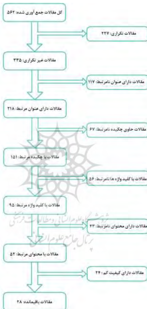
شکل ۲: نتایج جستجو و انتخاب مقالات