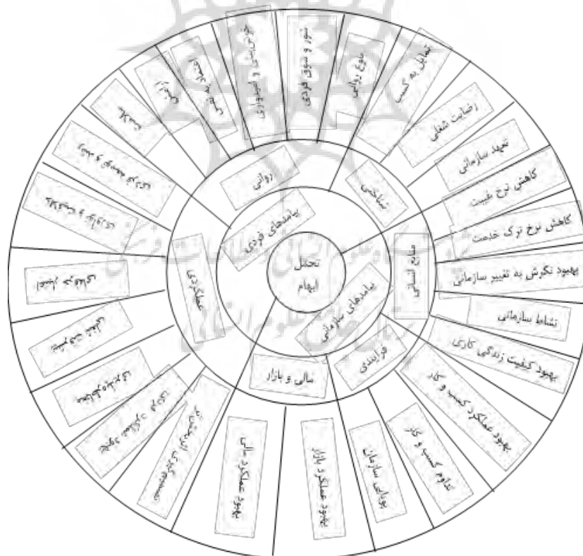
شکل ۱: شبکه مضامین پیامدهای تحمل ابهام رهبران

بر اساس تحلیل‌های انجام‌شده، شبکه مضامین پیامدهای تحمل ابهام رهبران در شکل شماره ۱ نشان‌داده شده‌است.