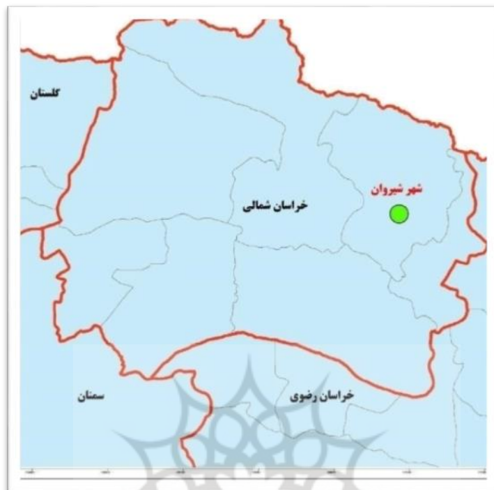
شکل (۱). موقعیت محدوده مورد مطالعه