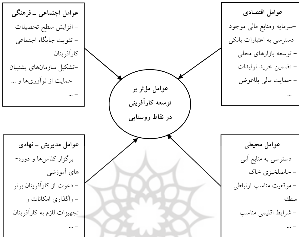
شکل (۱). عوامل مؤثر بر توسعه کارآفرینی در سکونتگاه‌های روستایی (جمینی، ۱۳۹۴: ۱۱۸)

در ادامه به نتایج چند پژوهش مرتبط با موضوع مورد مطالعه پرداخته شده است. نتایج پژوهش دادورخانی و همکاران (۱۳۹۰) با هدف تحلیل اثرات گردشگری در توسعه کارآفرینی در روستای کندوان نشان داد گردشگری به‌واسطه فراهم آوردن زیرساخت‌های اولیه و تعاملات فرهنگی میان جوانان روستایی، فرصت‌های جدیدی را برای کارآفرینی جوانان روستایی فراهم آورده است. ایمنی‌فشلاق و همکاران (۱۳۹۱) در مطالعه‌ای نقش گردشگری را در توسعه کارآفرینی زنان دو روستای کندوان و اسکندان (در شهرستان اسکو) بررسی کرده‌اند. نتایج نشان داد گردشگری در توسعه فرصت‌های کارآفرینی نقش به‌سزایی داشته و محیط روستاها را به یک محیط محرک و انگیزشی برای توسعه کارآفرینی تبدیل کرده است. نتایج پژوهش اربابیان و همکاران (۱۳۹۳) نیز نشان‌دهنده اثرات گردشگری بر توسعه کارآفرینی در نواحی روستایی است و امیری و همکاران (۱۳۹۵) نیز در مطالعه خود بر اثرات گردشگری کشاورزی بر توسعه کارآفرینی اذعان کرده‌اند. نتایج پژوهش صورت گرفته توسط سازمان مدیریت و برنامه‌ریزی استان کردستان (۱۳۹۸) در خصوص امکان‌سنجی فعالیت‌های کارآفرینی در سکونتگاه‌های روستایی شهرستان دیواندره و سقز نشان داد بخش‌های پرورش گیاهان دارویی، گردشگری، تولید آب معدنی، پرورش آبزیان، دامداری و کشت باغات، از پتانسیل بالایی در جهت توسعه فعالیت‌های کارآفرینی برخوردار هستند. نتایج پژوهش شاهد و همکاران (۱۴۰۰) در خصوص گردشگری و توسعه کارآفرینی پایدار در روستاهای بخش مرکزی شهرستان همدان نشان داد گردشگری