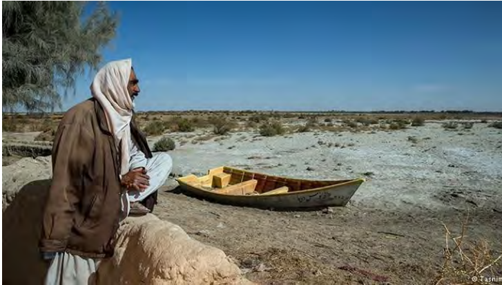
تصویر شماره سه: عدالت زیست‌محیطی

معنای بازنمودی: تنها شرکت‌کننده‌ای که در تصویر دیده می‌شود مردی میانسال است که بر اساس پوشاک و نیز با توجه به پوشش گیاهی منطقه از اهالی جنوب کشور (با توجه به خشکی توأم با وجود قایق به خاک نشسته، احتمالاً هامون خشکیده است) است. همین مرد تنها کنشگر موجود در تصویر است. بردار موجود در این تصویر فاقد هدف است و عملی بر کسی یا چیزی واقع نمی‌شود. به بیان دیگر فرانش بازنمودی در این تصویر از نوع کنشی ناگذر است و مرد موجود در تصویر در حالتی انفعالی و بدون ایجاد عمل و تغییر در شرایط موجود در تصویر، حاصل و برآیند عملکرد دیگران (خشک شدن دریاچه‌ای که وجود قایق و رنگ سفید نم‌کزار نشانه آن است) را نظاره می‌کند. تصویر در فرانش بازنمودی شرایط زیست‌محیطی را با نابرابری-های اجتماعی پیوند می‌دهد و مرد با نگاه منفعلانه به شرایط ایجاد شده در محیط تصویر به توزیع اجتماعی نابرابر زحمت‌ها و سودهای محیط زیستی اشاره می‌کند. همان‌طور که نیمانی می‌گوید «بی‌عدالتی زیست‌محیطی برای توصیف شرایطی به کار می‌رود که بخش‌هایی از یک جامعه به طور نامتناسبی بار مشکلات و آسیب‌های زیست‌محیطی را به دوش می‌کشند. در کشورهای صنعتی این بخش‌ها معمولاً منطقه‌هایی هستند که شرایط اقتصادی اجتماعی پایینی دارند.» (نیمانیس، ۲۰۱۲: ۶). در این تصویر نیز تأکید بر لباس و نیز موقعیت جغرافیایی منطقه چارچوب عدالت زیست‌محیطی را برای عکس تأکید می‌نماید.