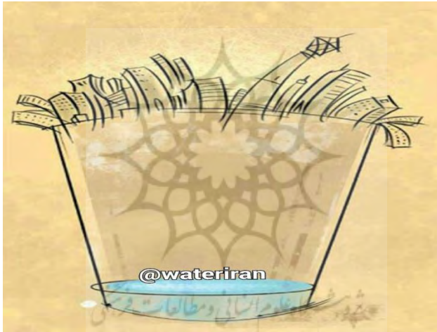
تصویر شماره یک: محیط‌زیست‌گرایی

محیط‌زیست‌گرایی یکی از چارچوب‌های کلانی بود که تصاویر بر مبنای آن چارچوب‌بندی شده بودند. محیط‌زیست‌گرایی را به‌گونه‌ای می‌توان زیرشاخه توسعه پایدار دانست که بر مدیریت بهتر محیط‌زیست با توجه به تأمین نیازهای نسل کنونی و به خطر نینداختن نیازهای نسل‌های آینده تأکید دارد. مفهوم توسعه پایدار به «شیوه غالب گفتگو و برنامه‌ریزی برای ایجاد رابطه‌ای بهبود-یافته میان جوامع و محیط طبیعی‌شان تبدیل شده است»، با توجه چنین رویکردی می‌توان گفت که توسعه پایدار بیان‌کننده تلاش برای یافتن راه‌هایی جهت ترکیب علائق متنوع کشورهای غنی و فقیر جهان است تا رد پای انسان بر محیط‌زیست کم‌رنگ شود (ساتن، ۱۳۹۳: ۲۱۸-۲۱۷).