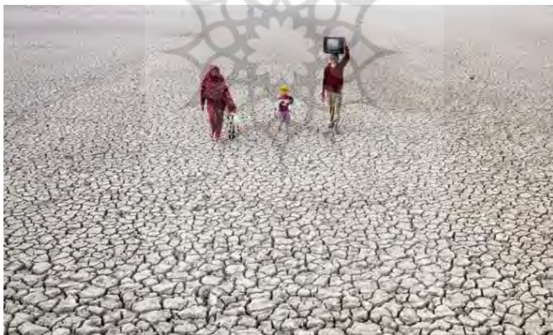
تصویر شماره ۲: محیط‌زیست‌گرایی

همچنین در بعد برجستگی جزییات این تصویر در پس‌زمینه و پیش‌زمینه از هم تفکیک نشده و تصویر به صورت تخت ارائه شده است. اما اندازه لیوان آب در برابر نمای شهری و بناهای آن، با توجه به این که تمامی بناها بر روی یک لیوان آب بنا شده‌اند که استواری‌شان به لحاظ بصری بستگی به پایه زیرین دارد، برجستگی خاصی را برای منابع آب ایجاد می‌کند. در نتیجه وضعیت تصویر در دو بعد ارزش اطلاعاتی و برجستگی، قاب‌بندی این تصویر یک قاب‌بندی کاملاً یکدست، ثابت و مستحکم است که هیچ جزئی از اجزای دیگر جدا نبوده و پیوستگی کامل در ترکیب‌بندی آن را به عنوان یک واحد اطلاعاتی مستقل عرضه کرد است. چیزی که در فرانشیز بازنمودی تصویر و پیوستگی کامل دو بردار تصویر نیز وجود دارد.