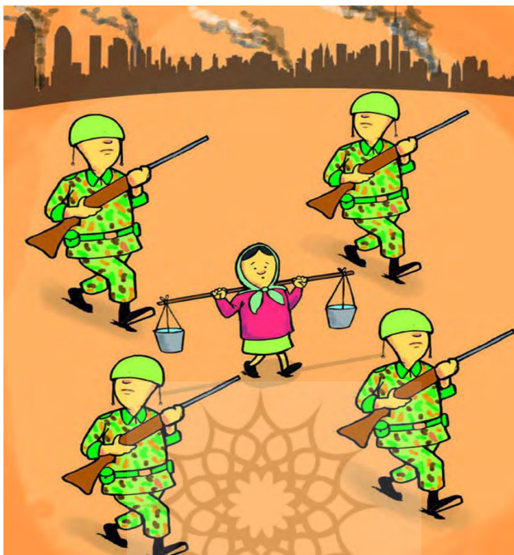
تصویر شماره ۷: امنیت زیست‌محیطی

معنای بازنمودی: در تصویر دختری با چهره‌ای وحشت‌زده و متعجب در حال حمل مقدار اندکی آب است و سربازان با حالت چهره‌های مرموز و مترصد خطر او را در این انتقال آب همراهی می‌کنند. چنین ساختار روایی در این تصویر ساختاری کنشی است که در آن برداری از کنشگران (دختر با همراهی دسته سربازان) منشعب شده و هدف (آب) حمل می‌گردد. ساختار روایی تصویر از نوع کنشی است چراکه عمل «حمل آب از مبدأ به مقصد» مشارکین بازنموده تصویر را به هم مرتبط کرده است. ساختار روایی از لحاظ گذرا یا ناگذرا بودن نیز گذرا است چراکه کنشگر تصویر از خود حرکتی ندارد، اما با انتقال آب آن را جابجا می‌کند و درعین حال احتمال جنگ در اثر درگیری نیروهایی با سربازان را تداعی می‌کند. اولین نشانه‌های تهدیدات امنیتی حاصل از مسائل زیست‌محیطی را می‌توان در کمبود منابع دید که وجود ظرف‌های کوچک آب که توسط دختری قابل حمل است چنین کمبودی را نشان می‌دهد. در پس‌زمینه این