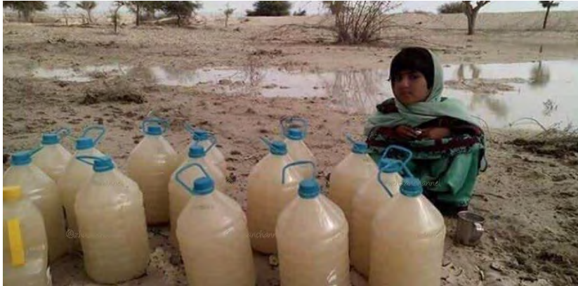
تصویر شماره ۴: عدالت زیست‌محیطی

معنای باز نمودی: در این تصویر، دختری خردسال (با لباس‌هایی که به همراه موقعیت جغرافیایی تصویر جنوب و به‌ویژه جنوب شرقی ایران را تداعی می‌کند) در حالتی ایستا و بدون وجود برداری مبنی بر تغییر و حرکت و کنش تصویر شده است. اجزای تصویر نیز همین وضعیت را دارند. فرانش باز نمودی تصویر در حالتی مفهومی ارائه شده است و شرکت‌کنندگان (دختری که ظرف‌های آب را از چشمه‌ای گل‌آلود برداشته است، بطری‌های آب، و زمین با پوشش گیاهی کویری) در دل ساختاری کلی (منطقه‌ای بحران‌زده از لحاظ منابع آبی) به یکدیگر مرتبط شده‌اند. چنین وضعیتی در تصاویر مربوط به فرایندهای مفهومی تحلیلی است که در این‌جا وضعیت بحران آب در منطقه‌ای محروم به عنوان حامل کلی و وضعیت کودک و شیوه جمع‌آوری آب و نیز پوشش گیاهی منطقه به عنوان ویژگی ملکی حامل، یا جزء دیده می‌شوند. در این‌گونه تصاویر از میان ویژگی‌های ملکی حامل تنها آن‌هایی که نقشی بسیار کلیدی دارند نمایش داده می‌شوند. ویژگی کلیدی حامل (منطقه‌ای محروم در جنوب) در این تصویر بحران آب است.