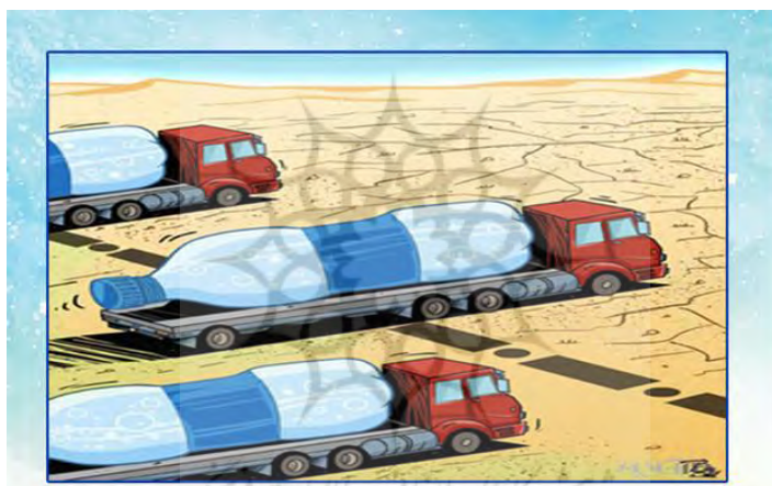
تصویر شماره پنج: اقتصاد سیاسی محیط‌زیست

اقتصادی این است که دائماً با ایجاد تقاضای مصرف‌کنندگان برای محصولات جدید سودآوری کند حتی تا جایی که اکوسیستم را به جایی برساند که از محدودیت‌های رشد یا ظرفیت حمل خود فراتر رود. از نظر وی کار مستمر تولید فرآیند پیچیده خود تقویت‌کننده‌ای است که بر اساس آن سیاستمداران به پیامدهای زیست‌محیطی حاصل از رشد اقتصادی سرمایه‌بر واکنش نشان می‌دهد. به‌عنوان مثال کمبود منابع نه با پایین آوردن مصرف و نه با اتخاذ سبک زندگی متفاوت بلکه با گشودن عرصه‌های جدید برای بهره‌برداری بیشتر حاصل می‌شود. از نظر اشنایبرگ کشمکش بین کار مستمر تولید و حفاظت از محیط‌زیست به یک تنش دیالکتیکی منجر می‌شود که در آن دولت-ها مجبور هستند بین نقش دوگانه خود به عنوان تسهیل‌کننده انباشت سرمایه و رشد اقتصادی و حفظ محیط‌زیست تعادل برقرار کنند (هانگین، ۱۳۹۳: ۴۳-۴۵).