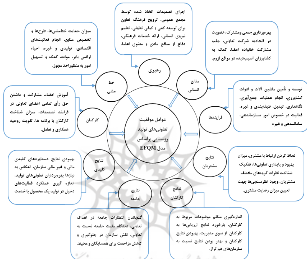
شکل ۱. چارچوب مفهومی پژوهش

با توجه به مرور پیشینه نگاشته‌ها و طراحی پرسشنامه طبق اساس نامه تعاونی‌های تولید روستایی، چارچوب مفهومی تحقیق به صورت شکل زیر طراحی گردید. در چارچوب مفهومی پژوهش براساس مدل EFQM نه معیار بر موفقیت تعاونی‌های تولید روستایی تأثیر گذارند که در نمودار زیر رسم شده است.