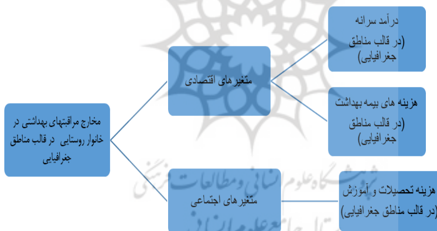
شکل ۲. مدل مفهومی متغیرهای مراقبت‌های بهداشتی در خانوارهای روستایی

لذا یکی از دلایل اهمیت بررسی شاخص‌های اثرگذار بر مراقبت‌های بهداشتی در مناطق روستایی این است که عدم شناسایی و بررسی این عوامل موجب عدم دستیابی به برنامه مشخص برای سوق دادن این مخارج به سمت توسعه و سلامت روستایی خواهد شد و به همین علت در این پژوهش تلاش می‌شود تا برخی از عوامل اثرگذار بر مراقبت‌های بهداشتی بررسی و ارزیابی شوند. بر این اساس طبق شکل (۲)، مدل مفهومی تحقیق به شرح زیر می‌باشد: