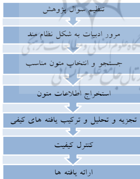
شکل ۱- گام‌های متوالی روش فراترکیب