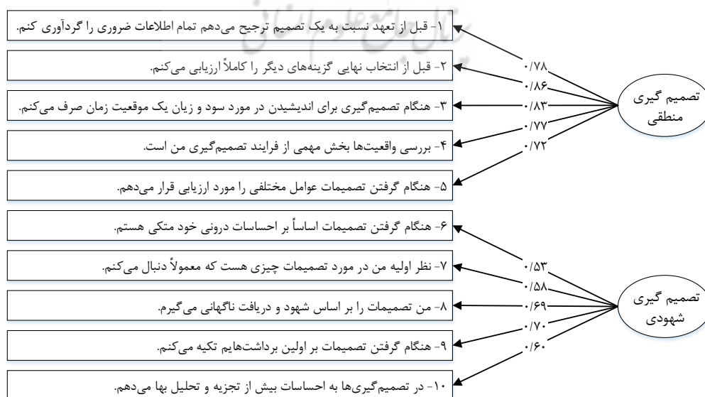
شکل ۱. بارهای عاملی سؤالات روی نمرات سبک‌های تصمیم‌گیری منطقی و شهودی (تمام بارها در سطح خطای ۰/۰۱ معنادار بودند)

پرسشنامه رفتار پرخطر، تکانشی و خود مخرب (Risky, Impulsive, and Self-destructive behavior Questionnaire): این پرسشنامه خودگزارشی دارای ۳۸ ماده است که تمایل عمومی به درگیری در رفتارهای پرخطر و خود مخرب را در ۹ حوزه رفتار غیرقانونی/مجرمانه، مصرف مواد، پرخاشگری، صدمه به خود، قمار بازی، رفتار جنسی پرخطر، مصرف سنگین الکل، غذا خوردن تکانشی و رانندگی یا پول خرج کردن بی‌مهابا را اندازه می‌گیرد (۱۵). در هر کدام از ماده‌ها، از شرکت‌کنندگان خواسته می‌شود که گزارش کنند در یک ماه گذشته و طول زندگی خود چند بار در این رفتارها درگیر شده‌اند. به منظور کاهش کجی مثبت، ابتدا پاسخ شرکت‌کنندگان به هر ماده بر اساس پنج طبقه (۰، ۱-۱۰، ۱۱-۵۰، ۵۱-۱۰۰ و بالاتر از ۱۰۰ بار) نمره‌گذاری می‌شود و سپس نمرات ماده‌های هر حوزه با هم جمع می‌شود تا نمره شرکت‌کننده در آن حوزه به دست آید. نمره بیشتر