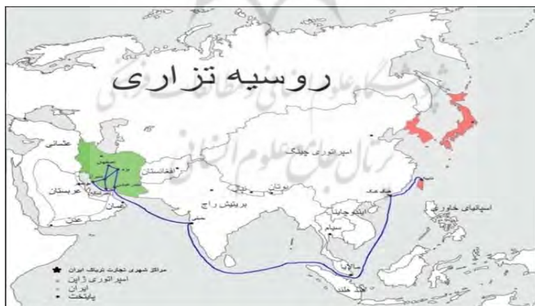
نقشه ۱. مسیر صادرات تریاک ایران به فرمانداری تایوان تا پایان قرن نوزدهم میلادی (قرن سیزدهم ق.).

حمایت وزارت خارجه را به کمک تیمسار فوکوشیما یاسوماسا دریافت داشت (یوناگا، ۱۳۹۲: ۳۹-۴۲). در سفرنامه‌ای که وی برای روزنامه کوکومین (Kokumin) فرستاد حرفی از تجارت تریاک زده نشده است. این مهم باتوجه به گستردگی و اهمیت کالای فوق نشان بر تلاش جهت مخفی نگاه داشتن مأموریت داشت. گزارش محرمانه (امروز غیرمحرمانه) تویوکیچی در آوریل ۳۳ میجی/۱۹۰۰م/۱۳۱۷ق به فرماندار جدید تایوان کوداما گنتارو (Kodama Gentaro) تقدیم شد که موضوع متن زیر، جهت بررسی در مقاله حاضر است. بجز بنادر بوشهر و بندرعباس میزان اندکی تریاک از طریق محمره به اروپا صادر می‌شد. البته باید گفت علاوه بر راه دریایی، میزان اندکی نیز از راه شیراز به سامسون سپس ترابوزان و از آنجا به قسطنطنیه می‌رسید که بندری به سوی اروپا و آمریکا بود. در کل می‌توان گفت صادرات سالانه تریاک ایران بین ۴۰۰۰ و ۵۰۰۰ صندوق بود. از آنجایی که دولت چین وارد کردن تریاک را منع کرده بود و ورود تریاک از هندوستان به این کشور دشوار شده بود، چین به طور تدریجی کشت تریاک را درون مرزهای خود تشویق کرد تا جلوی ورود تریاک هند را بگیرد (همان: ۱۸۵-۱۸۶). علی‌رغم تمام تمهیدات از جمله تأسیس اداره تریاک، این امر درآمد دولت فرمانداری هندوستان را در سال ۱۸۹۹م/۱۳۱۷ق را به نصف سال ۱۸۸۹م/۱۳۰۷ق رساند (همان: ۱۸۸). بنابر آنچه تا به حال در مقاله گفته شد می‌توان نقشه زیر را برای مسیر صادرات تریاک از ایران به فرمانداری ژاپنی تایوان ارائه داد: