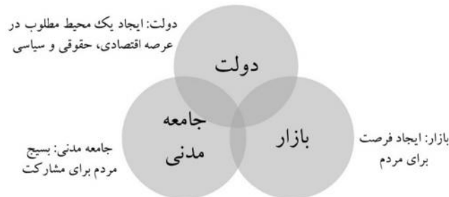
نمودار ۱. ارتباط سه کنش گر حکمرانی در تطبیق با تناسب نهادی منبع: اسلام (۲۰۱۷: ۲۷۷۳)

شکل بالا سه کنش گر اصلی حکمرانی را نشان می دهد: دولت، بازار و جامعه مدنی. این سه کنش گر علاوه بر این که خود مطابق با قواعدی خاص سازماندهی شده اند، براساس یک رابطه خاص با یکدیگر تعامل و تعامل دارند. دولت نماینده نهاد سیاسی، بازار نماینده نهاد اقتصادی و جامعه مدنی نماینده نهاد اجتماعی است. در نتیجه ارتباط سه کنش گر را می توان بازنمایی ای از ارتباط یا تناسب نهادهای اقتصادی، سیاسی و اجتماعی در نظر گرفت. در همین رابطه اسلام (۲۰۱۷) معتقد است که حکمرانی به صورت بندی و نظارت بر قواعد رسمی و غیررسمی اشاره دارد که قلمرو عمومی را تنظیم می کند، عرصه ای که در آن کنش گران دولتی و اقتصادی و اجتماعی برای تصمیم گیری با یکدیگر تعامل دارند.