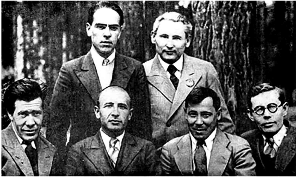
تصویر ۱۱. موسی جلیل و همکاران نویسنده‌اش، ۱۹۴۰؛ پایین، نفر دوم از راست (Gimadeev & Plamper, 2007: 101).