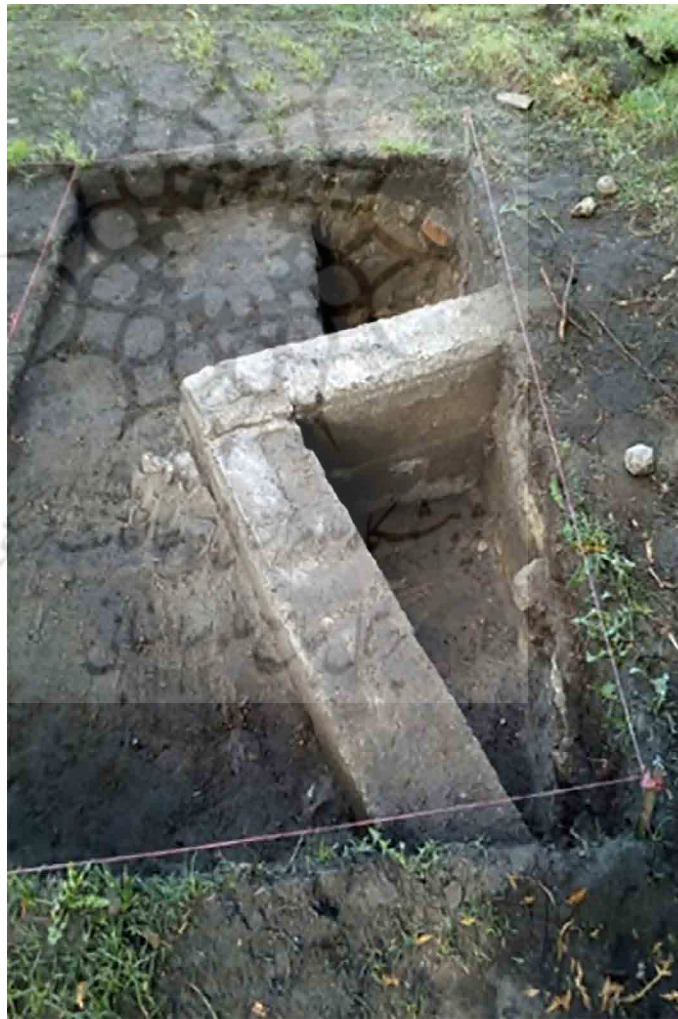
تصویر ۶ الف. عکس هوایی وضعیت فعلی محوطه اردوگاه، بخش‌های سفیدرنگ کارگاه‌های کاوش؛ ب. عمق پی بتنی کلبه اول (دنیل شفر).