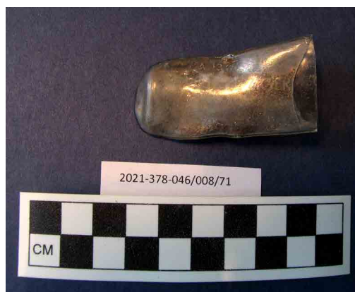
تصویر ۱۰. لوله آزمایش از شرکت داورسازی ملی لایپزیک (نگارندگان، ۱۳۹۹).