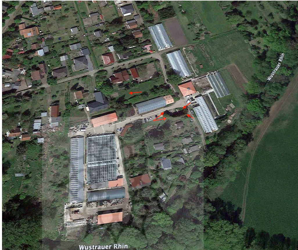
تصویر ۵. نشانه‌های قرمز کارگاه‌های کاوش سال ۲۰۲۰ م. (نگارندگان، ۱۴۰۰).

کاوش با مجوز اداره باستان‌شناسی و ابنیه ایالت برندنبورگ، با تمرکز کاوش بر کلبه‌های اردوگاه به‌ویژه کلبه اسرای معروف به «کلبه کارکرد اداری» و «کلبه بهداشتی» انجام گرفت. در فصل نخست کاوش از ۸ کارگاه کاوش، ۵ کارگاه ۱، ۲، ۶، ۷ و ۸ یافته‌های مادی، مرتبط به اردوگاه آموزش اجباری مسلمانان تاتار و نیز دوره متأخرتر به دست آمد (تصویر ۵).