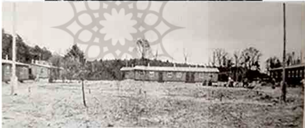
تصویر ۲. اردوگاه‌های کار اجباری، بالا، اردوگاه فهربلین عکس در سال ۱۹۳۸ م. پایین، اردوگاه کار وُسترا (Pagenstecher, 2004 b: 108).