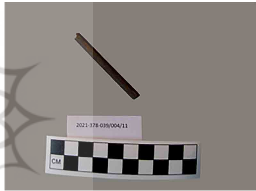
تصویر ۸. قلم نگارش (نگارندگان، ۱۳۹۹). Fig. 8. Writing pen (Authors, 2020).