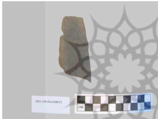
تصویر ۹. لوح نگارشی (نگارندگان، ۱۳۹۹). Fig. 9. Writing tablet (Authors, 2020).

مستندات تاریخی بیانگر آموزش روزانه شش ساعته در اردوگاه است، به این زمان بحث‌های تکمیلی و بررسی اوضاع اجتماعی روز نیز باید اضافه شود. در راستای تعلیم به منظور یادگیری اصول نازی، آن‌ها را برای بازدید به شهرهای مختلف آلمان نیز می‌بردند. سفرها و بازدیدها متنوع و برای دیدن بناهای قدیمی و جدید فرهنگی، کارخانه‌ها، سینما و غیره برنامه‌ریزی شده بود (Bundesarchiv, 1944, R6/592: 16-18). براساس یافته‌های به دست آمده از کاوش، به ویژه از کارگاه ۲، قلم نگارش (تصویر ۸) و تخته‌های سنگی سیاه شکسته که کاربرد نگارش متن و آموزش ریاضی است، به وضوح بخش آموزش و تعلیم را در این کارگاه تأیید می‌کند. بر روی یکی از الواح سنگی باریک، چهار ردیف خط منظم جهت نگارش و تعلیم خط (ادبیات و غیره) کشیده شده است. بر روی قسمت پشت این تخته سیاه، بخش بندی شده است و برای عملیات حسابرسی و آموزش حساب مورد استفاده قرار می‌گرفته است. این یافته به خوبی متون مکتوب تاریخی جهت تعلیم اجباری اسرا در نظام نازی‌ها را تأیید می‌کند (تصویر ۹).