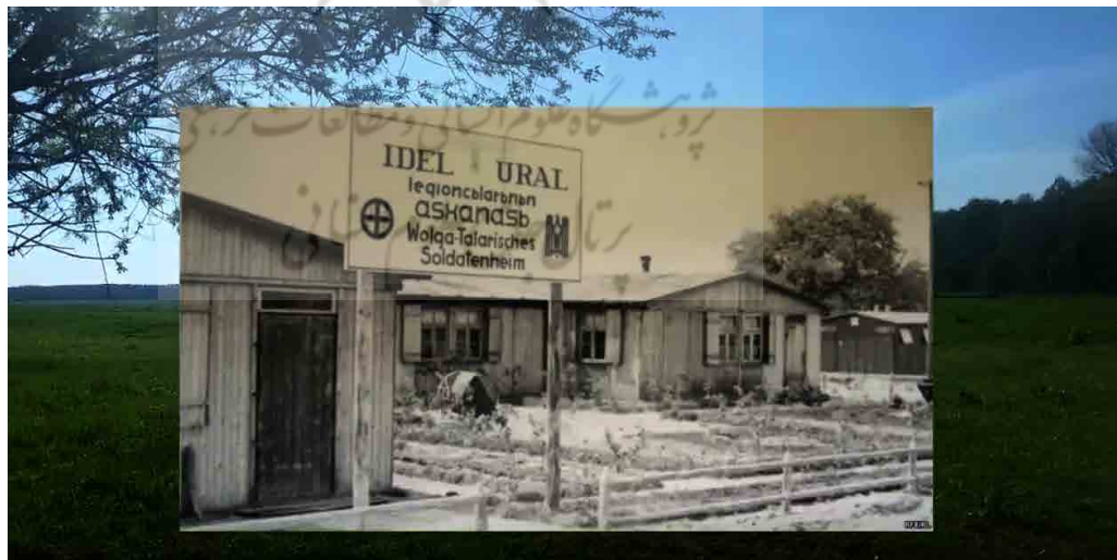
تصویر ۱. عکس بایگانی از اردوگاه گردان ایدل-اورال تاتار.

در محدوده جغرافیایی مورد مطالعه، هرچند بخشی از پرونده‌هایی که اطلاعات اردوگاه‌های کار اجباری در زمان اتمام جنگ و بعد از آن از بین برده شد، وجود اردوگاه‌های کار اجباری گروه‌های مختلف انسانی، مانند بازداشت‌شدگان آلمانی توسط «گشتاپو» در برلین و همچنین اسرای جنگ جهانی دوم در این استان گزارش شده است؛ بخشی از این اسرا و زندانیان در شرکت‌های آلمانی همکار رژیم نازی مانند «باست‌فازر» (Bastfaser) به بیگاری بی‌رحمانه‌ای گماشته شده بودند (Pagenstecher, 2004 B: 71-75; Pagenstecher, 2004 C: 108). با گشوده شدن جبهه جدید توسط آلمان‌ها در شرق، اسرای ارتش سرخ شوروی به این منطقه منتقل شدند. در سال ۱۹۴۲ م.، اردوگاه اسرای وُسترا در حاشیه جنوب شرقی روستا، تعداد ۱۵۰۰ اسیرجنگی با قومیت‌های مختلف که بخشی از آن‌ها از گروه‌های مسلمان تاتارهای معروف به «ولگاتاتار» از منطقه قفقاز بودند، نگهداری و تعلیم داده می‌شدند تا بعدها در گردان مشخص منطقه ایدل-اورال به خدمت گرفته شوند (Theilig, 2019: 25; Kuhlmann-Smirnov: 2004: 42; Bundesarchiv, 1944). (تصویر ۱).