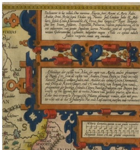
کارتوش نقشه لانگرن

«هنریش هوندیوس» گراوریست و نقشه کش آلمانی، گستره وسیعی میان دره رود نیل تا سواحل برمه را نمایش داده است. نقشه به زبان آلمانی و دارای مقیاس ۵۰ میلی متر به ۱۰۰ میلی یارد آلمانی است.