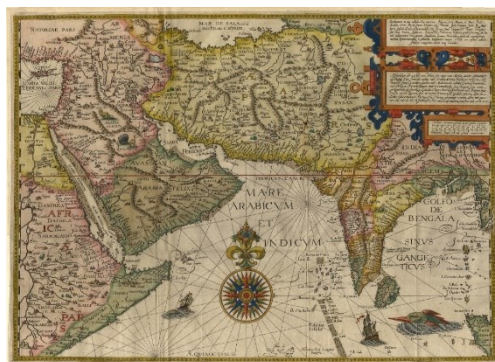
نقشه شماره ۵. پرشیا

Henricus (Hendricus) Florentinus van Langren (1574-1648)