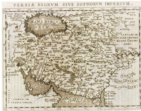
نقشه شماره ۶. پادشاهی پرشیا یا امپراتوری صفوی ۱۰

پرشیا منطبق با ایران، در میان عربیبا در باختر و سند و هند در خاور قرار دارد. البته مهم‌ترین بخش این نقشه از دیدگاه نام و مفهوم ایران، ثبت واژه پرشیا در کنار نام ایالت فارس ۱ است. تردیدی وجود ندارد که مقصود از واژه پرشیا نزد اروپاییان سده شانزدهم به بعد، گستره ایران امروز است نه ایالت فارس. در این نقشه قلمرو پرشیا از سرزمین‌های هم‌جوار هند و آرابیا با رنگی دیگر متمایز شده است. در نقشه لانگرن قلمرو ایران از شرق به ارمنستان، ۲ دیاربکر ۳ و بین‌النهرین، ۴ کلمده قدیم ۵ و بیابان عرب ۶ و از شمال به دریای نمک (یا کاسپی) و بخارا ۷ محدود است. گستره شرقی پرشیا در این نقشه مشخص نیست، اما در جنوب شرقی آن هند ۸ دیده می‌شود. جنوب نیز به دریای بزرگ پارس و یا اقیانوس هند ۹ محدود است.