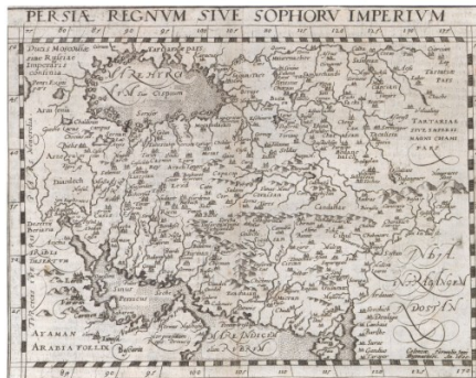
نقشه شماره ۷: قلمرو پرشیا (ایران) یا امپراتوری صفویه ۷

ماژینی در شهر «پادوا» ایتالیا به دنیا آمد و تحصیلاتش را در فلسفه در بولونیا به اتمام رساند، اما به ریاضی و کیهان‌شناسی علاقه‌مند شد. او در سال ۱۵۹۶ کتاب جغرافیای بطلمیوس را چاپ کرد و با نقشه‌های بطلمیوسی آشنا شد. او در ترسیم نقشه‌هایش به شدت تحت نفوذ کارهای مرکاتور، اورتلیوس و گاستالدی بود. زبان نقشه لاتین است و طول جغرافیایی ۸۳ تا ۱۳۰ درجه شرقی و عرض ۲۵ تا ۵۰ درجه شمالی را نمایش می‌دهد. مبدأ طول جغرافیایی در این زمان جزایر خالدات و عرض جغرافیایی خط استوا بود. عنوان نقشه گویاست و در آن پرشیا (ایران) برابر با قلمرو امپراتوری صفوی گرفته شده است. پرشیا (ایران) از شمال باختری به امپراتوری روسیه، ۱ از شمال به دریای هیرکانی، از غرب به گرجستان ۲ و جنوب باختری صحرای عربستان و از جنوب به یمن یا عربستان خوشبخت ۳ محدود است؛ زیرا قلمرو ایران طبق نقشه ماژینی تا جنوب خلیج فارس امتداد دارد. مرز ایران در جنوب به دریای هند که دریای سرخ هم نام داشته، ۴ متصل می‌شود. در شمال خاوری گستره پرشیا (ایران) به سرزمین تاتارها ۵ می‌رسد و شرق و جنوب شرقی هند یا هندوستان ۶ پایان مرزهای پرشیا (ایران) است.