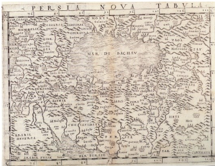
نقشه شماره ۲. نقشه جدید پرشیا [ایران] ۱

Giacomo Gastaldi (1500- 1565), Venice: 1548, 12/5× 17 cm (Al- Qasimi, 1999: 22)