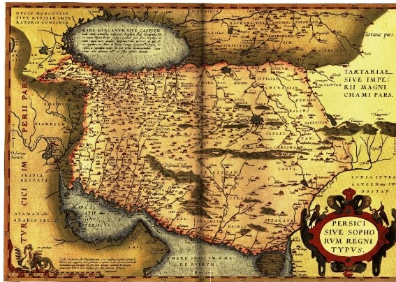
نقشه شماره ۴. پرشیا یا قلمرو صوفی ۳

نکته جالب در این مطالعه، انتخاب واژه پرشیاست که می‌توان آن را اقتباسی از کار گاستالدی دانست. او نیز مانند گاستالدی برخلاف سنت جغرافیایی بطلمیوس که از عنوان تابلوی پنجم آسیا برای معرفی گستره ایران استفاده می‌کردند، از واژه پرشیا در معنای نمایش گستره ایران استفاده کرده است. استفاده نقشه‌کشان اروپایی از عنوان پرشیا از نیمه قرن شانزدهم برای نمایش تمام ایران، می‌تواند به برآمدن صوفیان و شهرت و تأثیر آنها در جهان مربوط باشد.