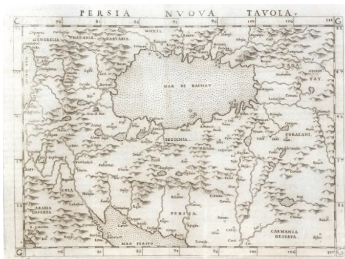
نقشه شماره ۳. نقشه جدید پرشیا [ایران] ۲

این نقشه با عنوان «نقشه جدید ایران» یکی از نخستین نمونه‌های چاپ نقشه جدید ایران در اروپا به شمار می‌رود (Alai, 2005: 37). چنان‌که به روشنی پیداست، منظور نقشه‌کش از پرشیا (ایران) منطبق با سرتاسر قلمرو صفویه و نه فقط ایالت تاریخی فارس است. انتخاب این عنوان پیروی سنتی بطلمیوسی بود که برای مناطق مختلف جهان از عنوان «Tabula» لاتین استفاده می‌کردند. البته استفاده از نام سرزمین ترسیم یافته، در نقشه‌های بطلمیوسی چندان رسم نبود، بلکه براساس نظام جغرافیانگاری بطلمیوس که آسیا به دوازده بخش تقسیم می‌شد، نقشه‌هایی که گستره ایران در آن قرار می‌گرفتند، بیشتر با عنوان «نقشه قسمت پنج آسیا» ۱ ترسیم می‌شد (برای آشنایی با نظام جغرافیایی بطلمیوس بنگرید به: انوری، ۱۳۹۶: ۱۸-۲۳؛ و برای نقشه‌های پنجم آسیا بنگرید به: Sahab, 2005: 1/20-23). تاریخ نقشه گاستالدی در سال ۹۵۵ق/۱۵۴۸م. هم‌زمان با بیست و پنجمین سال پادشاهی شاه طهماسب (۹۳۰-۹۸۴ق/۱۵۲۴-۱۵۷۶م) است که حکومت صفویه در آستانه پنجاه سالگی قرار داشت.