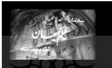
عنوان‌بندی شوهر آهوخانم (طاق‌بستان: خسرو دوم وسط تصویر، ایزدبانوی آناهیتا سمت راست و اهورامزدا سمت چپ)

کرمانشاه اشاره کند؟ یا عنصری معنا ساز در فیلم است؟ برای پی بردن به علت گزینش مکان، به بررسی دقیق تصویر طاق‌بستان می‌پردازیم. نخستین صحنه عنوان‌بندی از نمایی نزدیک گرفته شده است. گویا دوربین از پایین به تصویر می‌نگرد تا بلندی جایگاه آن مشخص شود. تصویری از نقش خسرو پرویز، پادشاه ساسانی، که به‌زعم گویری، آناهیتا ایزدبانوی آب‌های روان در سمت راست او با یک دست حلقه ایزدی و قدرت را به خسرو می‌بخشد و با دستی دیگر از سیوی که در دست دارد آب را که نشانه خیر و برکت است به پای او می‌ریزد (گویری، ۱۳۷۹: ۷۵). سمت چپ پادشاه، اهورامزدا قرار دارد که حلقه قدرت را به خسرو اهدا می‌کند (همان).