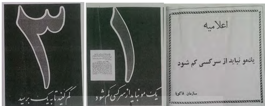
تصویر ۳) کارزار تبلیغاتی «سرشوی کمند» - روزنامه اطلاعات ۱۳۳۹/۶/۲۶ - ۱۳۳۹/۸/۲۷ - ۱۳۳۹/۸/۳۰

به شکل کارزار تبلیغاتی شکل داد. در این بین تبلیغات انتظاری بیش از سایر فن‌ها، بر حافظه تأثیر می‌گذارد همچون تبلیغ لاستیک دولوکس و سرشوی کمند.