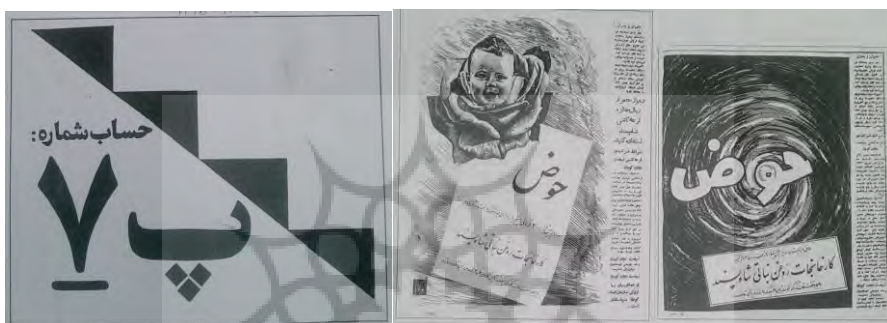
تصویر ۲) تبلیغ خدمات عمومی کارخانه شاه‌پسند (نهضت نجات کودک). روزنامه اطلاعات ۲۰-۲۳

«اساساً وقتی از کارهای خیر و کمک به نیازمندان صحبت می‌شد، بال درمی‌آوردیم. برای انجام کار خوب در خودمان ایمانی حس می‌کردیم؛ ولی مثلاً برای تبلیغ کازینو، این ایمان ایجاد نمی‌شد یا فروش سیگار... وقتی مسئله مبارزه با بی‌سوادی مطرح شد، این کار از نظر معنوی برای مان جالب بود» (میرزایی، ۱۳۹۲: ۳۱۵).