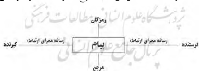
نمودار ۲) الگوی ارتباط یاکوبسن.

آن موضوع هم ابراز کنیم و بگوییم آن پدیده به نظر ما خوب است یا بد، زشت است یا زیبا، مطلوب است یا منفور، مؤدبانه است یا تمسخرآمیز. کارکرد کنایی یا حکمی ۱۵ این کارکرد رابطه میان پیام و «گیرنده» را مشخص می‌کند؛ چون هدف هرگونه ارتباط ایجاد واکنش نزد گیرنده است. حکم می‌تواند عقل گیرنده یا احساس او را هدف خود قرار دهد. در نتیجه، در این سطح هم می‌توان محتوای ارجاعی را با دلالت‌های عینی - شناختی دید و هم محتوای عاطفی را با دلالت‌های ذهنی - احساسی درک کرد. این کارکرد نقش بسیار مهمی در تبلیغات دارد که در آنجا، هم اطلاع‌رسانی و هم برانگیختن احساسات مخاطب به موازات هم وجود دارد. کارکرد هنری یا زیبایی‌شناختی ۱۶ یاکوبسن این کارکرد را همچون رابطه میان پیام و خود «پیام» تعریف می‌کند. نمونه واضح کارکرد زیبایی‌شناختی در آثار هنری دیده می‌شود، جایی که مرجع پیام خود پیام است، و این پیام دیگر ابزار ارتباط نیست، بلکه موضوع آن است. کارکرد همدلی ۱۷ مرجع پیام همدلانه خود «ارتباط» است. هدف این کارکرد، برقراری، حفظ یا توقف ارتباط است و یا برای جلب توجه مخاطب یا حصول اطمینان از هوشیاری اوست. نهایتاً کارکرد فرازبانی ۱۸ که هدف آن، روشن کردن معنای نشانه‌هایی است که ممکن است گیرنده آنها را نفهمد. مثلاً کلمه‌ای در گیومه قرار می‌گیرد یا توضیح داده می‌شود. در اینجا مرجع پیام، خود «رمزگان» است. انتخاب رسانه نیز به کارکرد فرازبانی مربوط می‌شود. کادر یک تابلو، و یا طرح روی جلد یک کتاب، که ماهیت رمزگان را به نمایش می‌گذارد، انواع دیگری از کارکرد فرازبانی است.