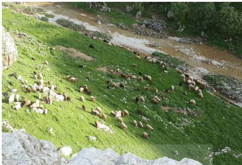
شکل ۵. اندازه یک گله گوسفند و بز در آسمان آباد