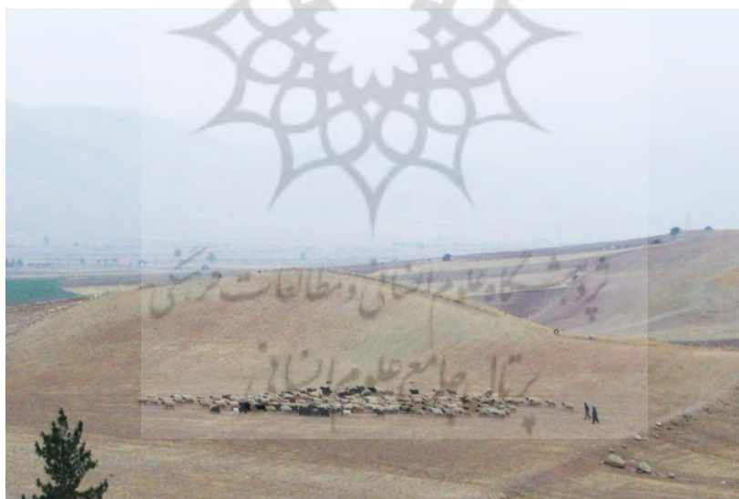
شکل ۶. اندازه یک گله گوسفند و بز در دشت ایوان نزدیک روستای ترن