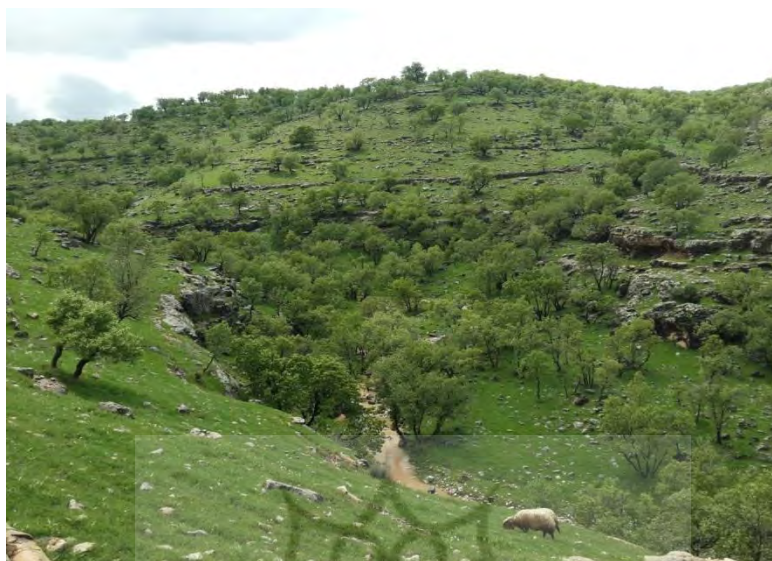
شکل ۷. مراتع جنگلی نواحی سردسیر در فصل بهار