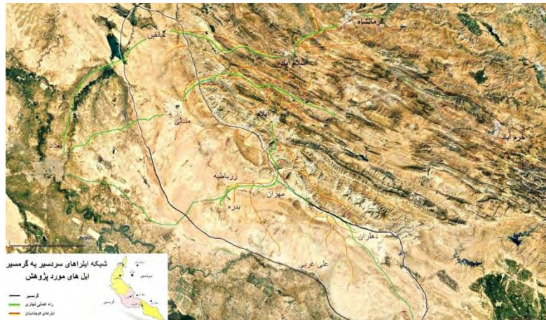
شکل ۱. شبکه ایل‌راه‌های ایل‌های مورد پژوهش و محدوده گرمسیر آن‌ها در شرق بین‌النهرین

کالاها و تولیدات عشایری در فصول معین و نیاز مستمر خانوارها، مدت‌داربودن معاملات و کاهش مستمر قدرت خرید کوچ‌نشینان از ویژگی‌های عمده مبادلات (اقتصادی) آن‌ها به‌شمار می‌رود» (مشیری و مولایی، ۱۳۷۹: ۱۱۹).