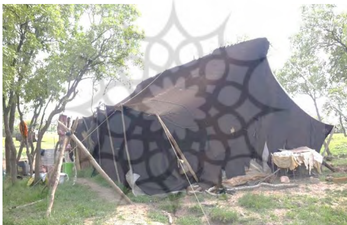
شکل ۳. سیاه‌چادر کوچ‌نشینان خزل در نواحی سردسیر در اواسط بهار (ارتفاعات بانکول)

سه کلاف برای حلقه‌های حاشیۀ سیاه‌چادرها لازم است. برای بافت هرکدام از طناب‌های نگهدارنده اطراف سیاه‌چادر که هشت متر طول دارند و به‌صورت گیسویی و متراکم بافته می‌شوند، حدود یک کلاف نخ موئین (حدود چهار کیلوگرم نخ) نیاز است که برابر با موی دو یا سه بز است. از طرف دیگر تبدیل مو به نخ به‌صورت دستی در مرحله اول به‌صورت فتیله‌ای و در مرحله دوم به نخ به‌صورت همیاری توسط زنان فامیل و همسایه‌ها با دوک نخ‌ریسی دستی ریسیده می‌شود که حدود یک تا دو ماه زمان می‌برد. دار بافت سیاه‌چادر به‌صورت زمینی و به‌صورت ساده تخته به تخته انجام می‌گیرد که دوازده تخته (بسته به اندازه سیاه‌چادر بین دوازده تا شانزده) به‌صورت همیاری، دو تا سه ماه زمان نیاز دارد و در اواخر فصل بهار (اردیبهشت‌ماه، بهار کردی ۱ ) و تابستان انجام می‌شود. از آنجا که بافت سیاه‌چادر زرهی و شل است (یکی از رو یکی از زیر)، بافتن آن سریع صورت می‌گیرد (شکل ۳).