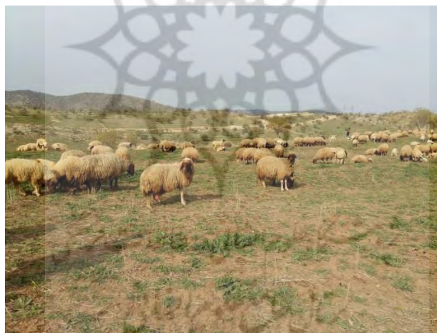
شکل ۴. گلهٔ گوسفند در اوایل بهار-سردسیر بانکول

مراتع کبیرکوه توان چرای حداقل بیست میلیون رأس دام را دارد. ۱ رزم‌آرا هنگام دیدار از این منطقه تعداد بز، گاو و گاومیش‌ها را هفتاد هزار رأس و تعداد گوسفندان را حدود ۲۵۰ هزار رأس دانسته است (رزم‌آرا، ۱۳۲۰: ۲۸-۲۹). تعداد دام‌ها در پی خشکسالی‌ها و کمبود علوفه در طی سال‌های مختلف متغیر بود. چنان‌که این آمار تقریبی رزم‌آرا پس از قحطی‌های سال‌های جنگ جهانی اول و تخته‌قاوشدن عشایر و بستن ایل‌راه‌ها توسط ارتش بود که به نابودی و تلف‌شدن بخش عمده‌ای از جمعیت انسانی و دام‌های آن‌ها منجر شد. اثرات مخرب آن بر اقتصاد منطقه تا دهه‌های بعد -به گواهی مسافران بیگانه‌ای که از این منطقه گذشته‌اند و فقر و فلاکت گسترده‌ای را که در این مناطق مشاهده کرده‌اند- باقی مانده بود که گسترش ناامنی، از پیامدهای آن به‌شمار می‌آید. بررسی نگارنده بین عشایر نیز مؤید همین مطلب است که هر خانوار دارای حدود ۱۵۰ رأس گوسفند و بز (شکل‌های ۵ و ۶) بوده است. ترکیب دام‌ها نیز به این شکل بود که به ازای هر ۴۰ رأس گوسفند ماده یک قوچ نر را نگه می‌داشتند و ۳۰ تا ۴۰ رأس بز برای تأمین موی بز برای بافت سیاه‌چادر و طناب‌های آن و همچنین گوشت خانوار و تعدادی گاو و ورز او و اسب و قاطر و الاغ برای حمل‌ونقل و شخم‌زنی نگهداری می‌کردند.