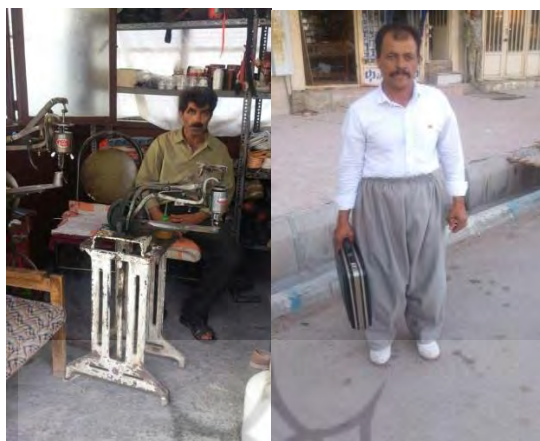
تصاویر ۳ و ۴. شغل کفاشی و ختنه

بی‌توجهی به آینده‌نگری و برنامه‌ریزی در جهت پیشرفت کیفیت زندگی، اغلب آن‌ها وضعیت مادی و رفاه مناسبی ندارند.