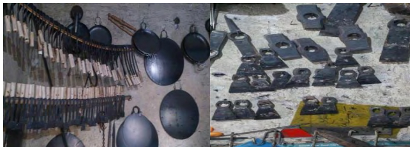
تصاویر ۷ و ۸. آهنگری و ساختن ابزار کشاورزی