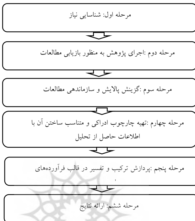
شکل ۱: الگوی شش مرحله‌ای روبرتس (مارش، ۱۳۹۲)

پس از گردآوری داده‌ها با استفاده از این روش، داده‌ها، یافته‌ها و نتایج پژوهش‌ها به تفکیک استخراج و مورد تحلیل و بررسی قرار گرفتند و با ترکیب و تلفیق نتایج بدست‌آمده از تحلیل پژوهش‌های مرتبط جنبه‌های مختلف برنامه درسی با رویکرد شناختی در یک ساختار کلی در قالب هر یک از مؤلفه‌های ده‌گانه اگر ارائه شد. در جدول ۱، هر یک از مؤلفه‌های ده‌گانه اگر با پرسش مربوط به آن آورده شده‌است.