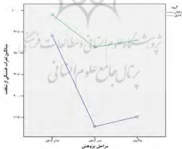
شکل ۱. نمودار خطی مقایسه میانگین نمرات خستگی از شفقت در مرحله پیش‌آزمون، پس‌آزمون و پیگیری در دو گروه