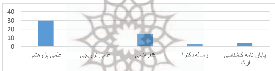
نمودار ۳- توزیع پژوهش‌های انجام شده در سطح رساله‌های دکترا و پایان‌نامه‌های کارشناسی ارشد، مقالات علمی-پژوهشی، علمی ترویجی و ژورنالی کنفرانسی

همچنین از میان ۵۴ منبع مورد بررسی در این بخش بیشترین فراوانی متعلق به مقالات علمی پژوهشی با ۳۰ مورد و پس از آن به ترتیب مقالات کنفرانسی ۱۵ مورد، پایان‌نامه‌های کارشناسی ارشد ۵ مورد، رساله‌های دکترا ۳ مورد و نهایتاً از میان مقالات علمی ترویجی ۱ مورد مطالعه مرتبط و پوشش دهنده هدف این بخش از پژوهش حاضر یافت شد.