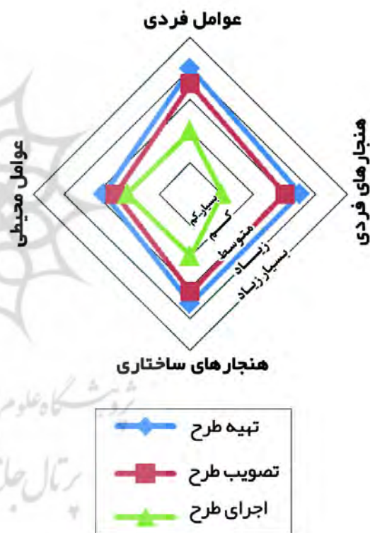
تصویر ۲- مقایسه مطلوبیت مؤلفه‌های رویکرد محتوایی تصمیم‌گیری اخلاقی در فرایندهای تهیه تا اجرای طرح.

با بررسی تصویر ۲، می‌توان به مشابهت نسبی مطلوبیت فرایندهای تهیه و تصویب و اختلاف قابل توجه فرایند اجرا با آنها در تمام مؤلفه‌ها اشاره نمود. همچنین در بین عوامل مؤثر، عوامل فردی بیشتر از عوامل محیطی مورد توجه بوده است و