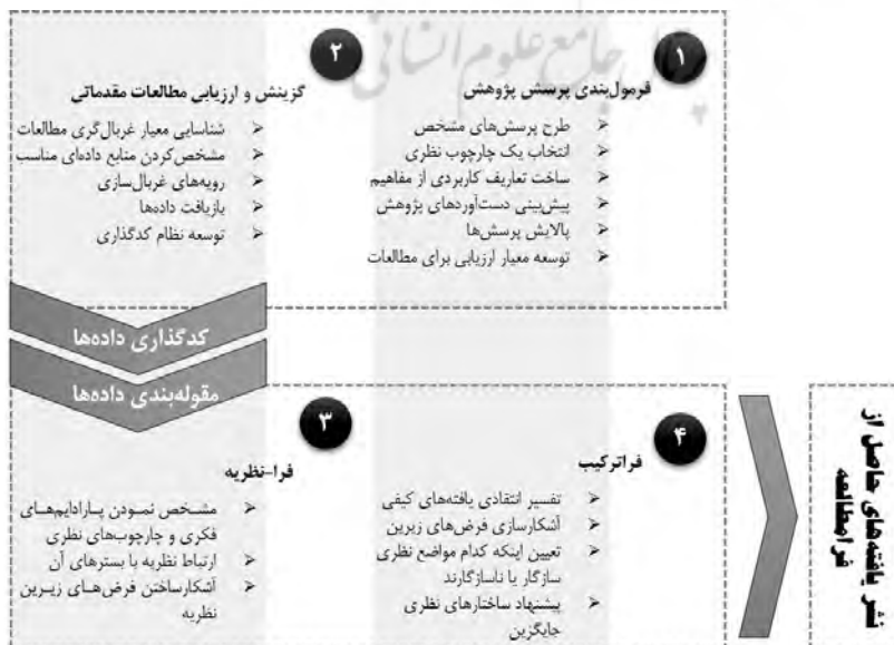
نمودار ۲- مراحل راهبرد فرامطالعه.