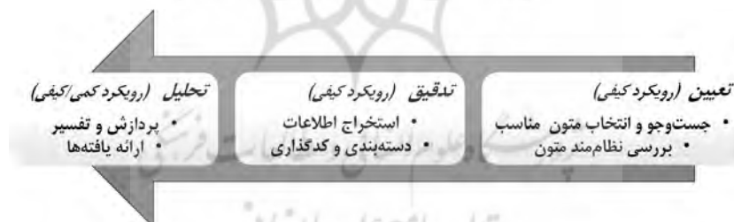
نمودار ۱- فرایند پژوهش.

لازم به ذکر است که پژوهش حاضر در سه مرحله؛ تعیین، تدقیق و تحلیل انجام شده است. در مرحله تعیین، تمامی اطلاعات موجود درباره پژوهش جمع‌آوری و برداشت شد. در مرحله تدقیق، تمامی مقاله‌های گردآوری‌شده بر اساس پارامترهای ارزیابی (محورها و مقولات تحلیلی)، دسته‌بندی و کدگذاری شدند. در مرحله تحلیل نیز، همه اطلاعات استخراج‌شده از مقاله‌های منتخب در بازه زمانی ۱۳۸۳-۱۳۹۴، پردازش، تحلیل و تفسیر شدند.