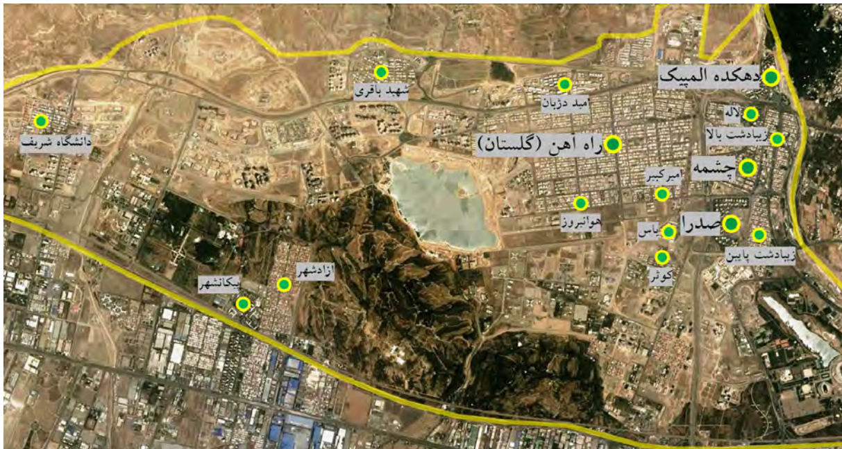
تصویر ۱- موقعیت شهرک‌های منطقه ۲۲ با سابقه توسعه و سکونت بالغ بر یک دهه.