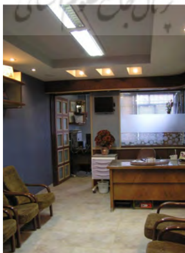
تصویر ۴- ارتباط فضای انتظار با میز پذیرش و اتاق دندانپزشک.