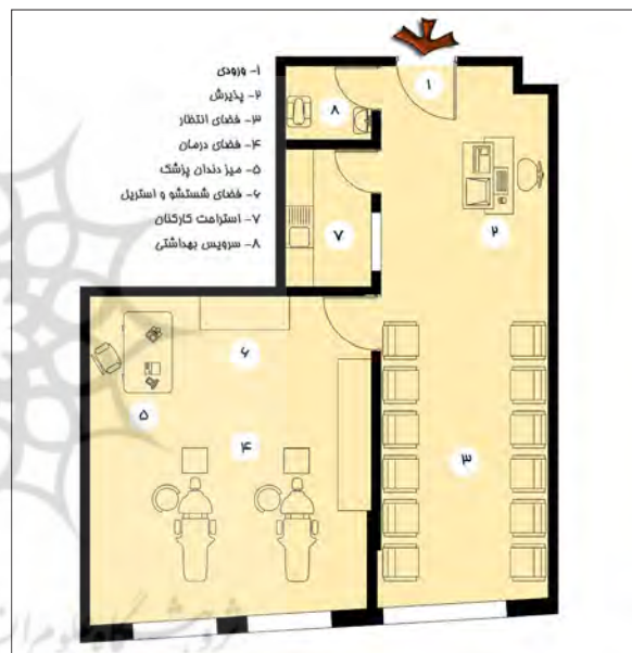
تصویر ۱- پلان مطب دندان پزشکی پیش از تغییرات.