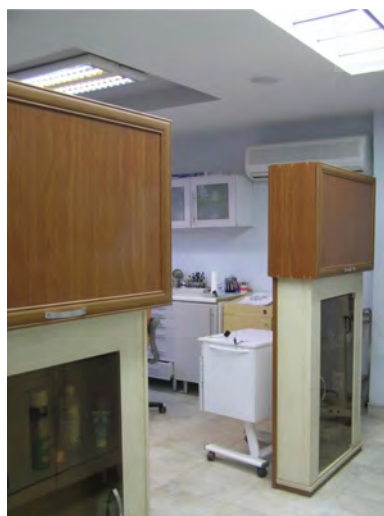
تصویر ۵- جداسازی بخش درمانی از فضای شستشو و استریل.