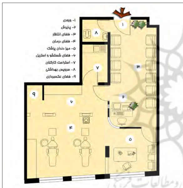
تصویر ۲- پلان مطب دندان پزشکی پس از تغییرات.