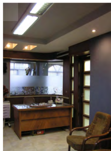
تصویر ۳- ارتباط فضای انتظار با میز پذیرش و اتاق دندانپزشک.