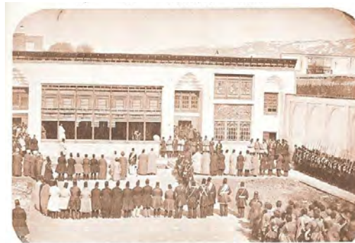
۱۰- مراسم سلام مظفرالدین میرزا ولیعهد در تبریز، محل برگزاری سلام عمارت حرمخانه در کاخ عالی قاپوی آن شهر است. دهه ۱۳۰۰ هـ. ق. ۱۳۰۰-۱۳۰۱ هـ. ق.

تصویری از این فضا موجود است که در زیرنویس آن آمده است: «مراسم سلام مظفرالدین میرزا ولیعهد در تبریز، محل برگزاری سلام عمارت حرمخانه در کاخ عالی قاپوی آن شهر است. دهه ۱۳۰۰ هـ. ق.»