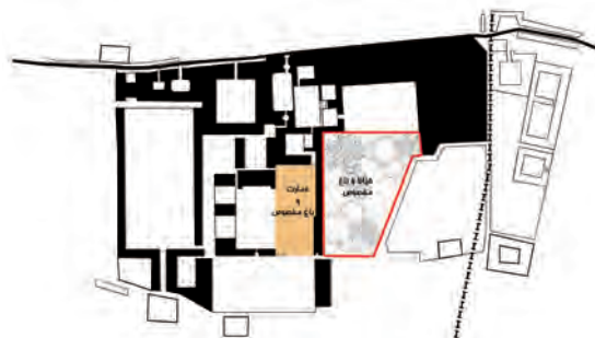
تصویر ۱۱- ساختار فضایی عمارت و باغ مخصوص در مجموعه قصر حکومتی دارالسلطنه بر اساس مستندات تاریخی.