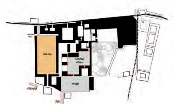
تصویر ۴- ساختار فضایی جبه خانه در مجموعه قصر حکومتی دارالسلطنه بر اساس مستندات تاریخی.