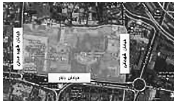
تصویر ۱- موقعیت کنونی سایت مجموعه قصر حکومتی در سال ۱۳۹۲ ه. ش.