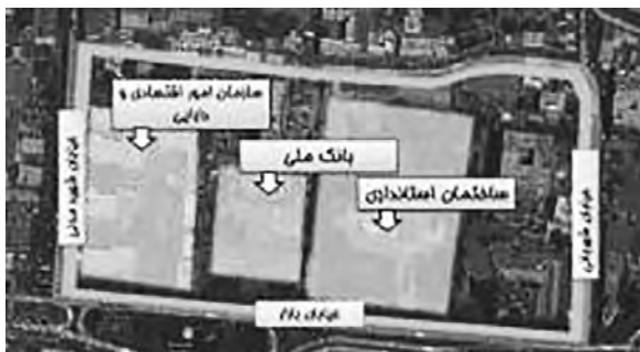
تصویر ۲- موقعیت کنونی ساختمان‌های واقع در سایت مجموعه قصر حکومتی در سال ۱۳۹۲ ه. ش.

مجموعه قصرهای حکومتی دارالسلطنه ۲ تبریز یکی از باارزش‌ترین ساخت و سازهایی است که در دوره قاجار ساخته شده بود که با توجه به اندک اسناد تصویری باقی مانده در نوع خود منحصر به فرد بوده است. این مجموعه در مرکز شهر و ضلع شرقی بازار تبریز در محدوده نسبتاً وسیعی با مساحتی برابر ۷،۵ هکتار واقع شده بود.