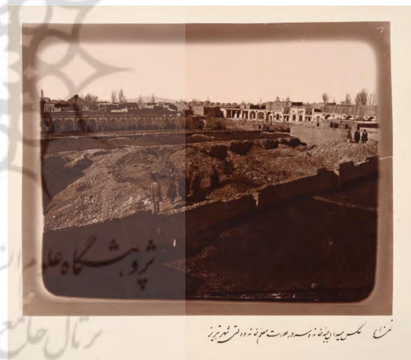
تصویر ۳- تصویر میدان جبه خانه.