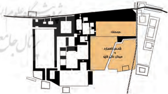
تصویر ۱۲- ساختار فضایی میدان عالی قاپو، شمس العماره و بناهای اطراف آن در مجموعه قصر حکومتی دارالسلطنه بر اساس تصاویر و متون موجود.