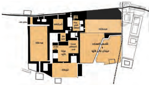
تصویر ۱۳- ساختار فضایی مجموعه قصر حکومتی دارالسلطنه براساس مستندات تاریخی.

ساختار فضایی مجموعه قصر حکومتی را می توان در تصویر ۱۳ مشاهده کرد.