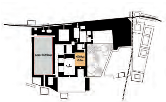
تصویر ۶- ساختار فضایی دیوانخانه مجموعه قصر حکومتی دارالسلطنه بر اساس مستندات تاریخی.