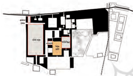
تصویر ۸- ساختار فضایی حیاط تکیه در مجموعه قصر حکومتی دارالسلطنه براساس مستندات تاریخی.

این واژه در لغت به معنای ۱- محل حفاظت توپ‌ها. ۲- واحدی در نظام که وظیفه آن تیراندازی با توپ است. یرمولف، گزارش جامع و روشنی به دربار روسیه فرستاده و در آن صریحاً نوشته بود که: عباس میرزا پسر دوم شاه که اعلان کرده‌اند ولیعهد است به یاری انگلستان اصلاحات مهمی را شروع کرده است و لشکریان عظیمی براساس بسیار منظمی تشکیل می‌دهد. توپخانه وضع کاملی دارد و روزافزون است (نجمی، ۱۳۷۷، ۹۰). توپخانه موسعی هم در جنب دیوانخانه ساخته‌اند