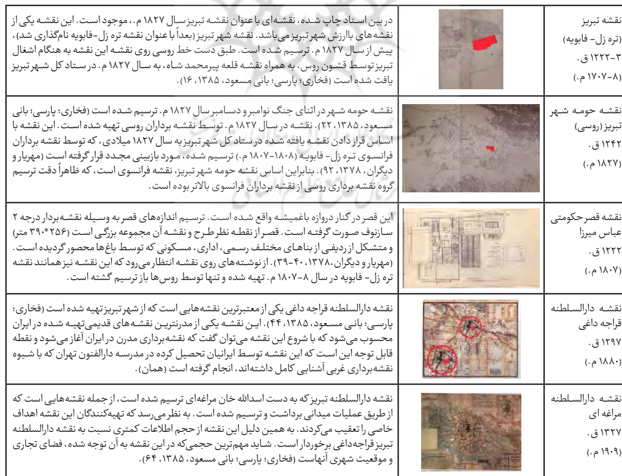
جدول ۱- نقشه‌های تبریز دوره قاجار.

همانطور که در بررسی وضعیت کنونی مجموعه مشخص گردید، در حال حاضر هیچ اثری از عمارت‌های مجموعه قصر حکومتی باقی نمانده و بناهای جدید در این محل احداث گردیده است. بنابراین ضروری است که در ابتدا از نقشه‌های تهیه شده از شهر تبریز در دوره قاجار استفاده گردد تا موقعیت مجموعه قصر حکومتی و مکانیابی عمارت‌ها بازخوانی گردد. تبریز از معدود شهرهای ایران است که تاکنون ۱۰ نقشه، به صورت کروکی و یا ترسیم به شیوه مدرن از آن در دست است (تهرانی و دیگران، ۱۳۸۵، ۱۰). مجموعه قصرهای حکومتی دارالسلطنه در ۵ نقشه که در دوره قاجار ترسیم گردیده، مشخص می‌باشد (جدول ۱).