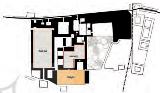
تصویر ۷- ساختار فضایی توپخانه در مجموعه قصر حکومتی دارالسلطنه براساس مستندات تاریخی.

جدول ۴- تصاویر توپخانه (آرشیو اسنادی کاخ گلستان).