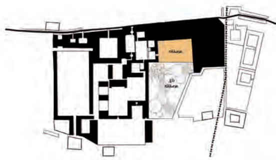
تصویر ۱۰- ساختار فضایی حرمخانه در مجموعه قصر حکومتی دارالسلطنه بر اساس مستندات تاریخی