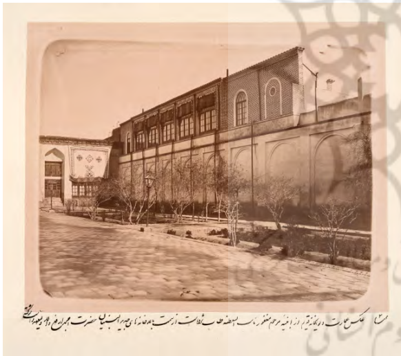
تصویر ۵- تصویر دیوانخانه.

این واژه در لغت به معنای (دیوان + خانه) بارگاه سلطنت. عدالتخانه. (ناظم الاطباء). محکمه. دارالقضاء. دارالحکومه. (ناظم الاطباء). اداره حاکمی. محل نشستن امراء و ارباب دفاتر. (آندراج). مقابل اندرون خانه. بیرونی. در متون آمده است: «امروز چهارشنبه بیست و هفتم باید به صرف نهار به عمارت ولیعهد که در شهر است برویم. رفتیم به دیوانخانه ولیعهد که تازه صاحب دیوان ساخته و بسیار خوب عمارتست. از آنجا به دیوانخانه قدیم نایب السلطنه رفتیم. پس از آن به عمارت و باغ اندرونی ولیعهد رفته، قدری گردش کرده و آمدیم بیرون در تالار نشستیم. بعد رفتیم نزدیک عمارتی که سرایزخانه قدیم بود» (قاجار، ۱۳۶۳، ۳۰). تصویری نیز این بنا موجود است که در زیرنویس آن آمده است: «عکس عمارت دیوانخانه قدیم از ابنیه مرحوم مغفور نایب السلطنه طاب ثرا است از سمت بالاخانه های جدید بنیان حضرت امجد ارفع والد ولیعهد دا شوکتی»