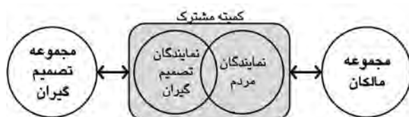
نمودار ۴- مدل پیشنهادی برای جلب مشارکت.