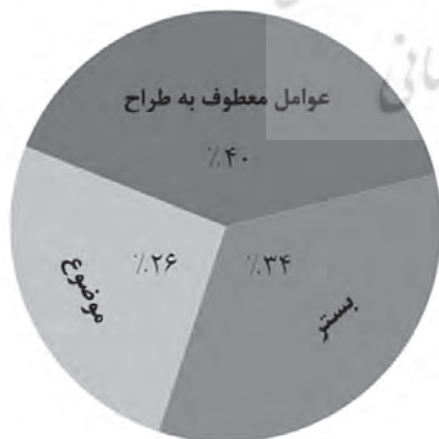
تصویر ۲- سهم هر یک از منابع سه‌گانه در شکل‌گیری ایده اولیه معماران.

در مطالعه حاضر، همان‌گونه که در تصویر ۱ دیده می‌شود، نزدیک به ۶۰ درصد از ایده‌های اولیه معماران معطوف به مسئله بوده و ۴۰ درصد ایده‌ها، فارغ از مسئله، از ذهن طراح نشأت گرفته‌اند. از میان ۶۰ درصد طرح‌هایی که ایده اولیه‌شان زائیده توجه به مسئله است، حدود ۳۴ درصد سهم بستر طراحی و نزدیک به ۲۶ درصد سهم موضوع طراحی است (تصویر ۲). در بعضی از موارد، تشخیص اینکه معمار ایده اولیه‌اش را صرفاً از یکی از منابع ایده‌پردازی گرفته باشد، بسیار دشوار می‌نمود و در موارد اندکی (برای مثال پاسبان حضرت ۱۳۸۹، ۱۳۹۰) نیز سهم دو منبع در شکل‌گیری ایده پررنگ‌تر به نظر می‌آمد. اشاره به سهم منابع در ایده‌پردازی معماران نیز حاکی از همین مطلب است که اگر از میان بستر، موضوع و عوامل معطوف به طراح، یکی به عنوان منبع اصلی ایده‌پردازی معمار در پروژه‌ای خاص معرفی می‌شود باید سهمی هر چند اندک نیز برای منابع دیگر در نظر گرفت.