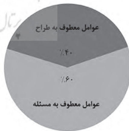
تصویر ۱- سهم مسئله و داشته‌های طراح در شکل‌گیری ایده اولیه معماران.

موقعیت طراحی با تعامل طراح و مسئله شکل گرفته و مواجه شدن طراح با مسئله طراحی آغازگر فرایند طراحی است. تحلیل پاسخ‌های معماران نشان داد که هرکدام از آنها در رویارویی با مسئله طراحی، بر یکی از عناصر موقعیت طراحی