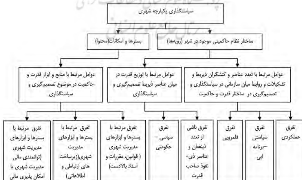
نمودار ۱- مدل تحلیلی تحقیق.