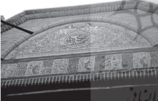
تصویر ۱۸- سردر سنتوری و سرتاسر کاشیکاری شده خانه ای اروپایی در محله بازار.