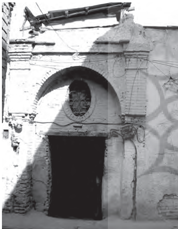
تصویر ۹- روزن بیضی شکل خانه ای تلفیقی واقع در هشتی متصل به معبر محله چال میدان.

بر خلاف خانه های سنتی، در بالای اکثر درهای ورودی، روزن دیده می شد که این روزن ها، شکلی مستطیلی و گاه بیضی و کارکردی دو جانبه داشت؛ به این ترتیب که در روز، نور را به درون هشتی می رساند و در شب، نور ناشی از چراغ واقع در هشتی را به فضای جلوی در هدایت می کرد (همان، ۴۴، ۱۲۳؛ تصویر ۹). در موارد معدودی نیز در یکی از طرفین ورودی، وجود تک پنجره ای کوچک به چشم می خورد. سردر خانه ها یا ساده بود و یا با گچ، آجر، کاشی یا ترکیبی از آنها و به ندرت با طرحهای هلالی و سنتوری آراسته می شد و اغلب بر سطح آن، کتیبه کاشی یا مرمری به خط نستعلیق و با همان مضامین قبل به چشم می خورد (تصویر ۱۰). گاهی نیز در بالای سردر برخی از خانه ها، عنصر بالاخانه به کار می رفت که تا حدی متفاوت از نمونه های پیشین بود و معمولاً در فضای آن، ستون هایی ساده، طاق هایی هلالی یا نرده هایی صراحی شکل مشاهده می شد (تصویر ۱۱).