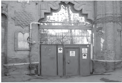
تصویر ۱۶- نمایی از خورشیدی کله در و درب ورودی خانه اتحادیه در محله دولت.