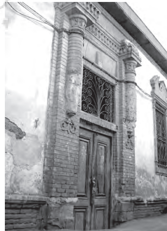
تصویر ۱۵- فضای ورودی خانه ای به سبک اروپایی در محله چال میدان.

همانگونه که پیشتر ذکر شد، اکثر خانه ها دارای پنجره بودند، اما این پنجره به تدریج به عنوان عنصری مهم در نمای خارجی، در ترکیب معمارانه با فضای ورودی قرار گرفت و در بخش بالایی سردر بعضی از خانه ها به کار گرفته شد (تصویر ۱۹). البته پنجره تنها عنصری نبود که در ترکیب با فضای ورودی به کار رفت، بلکه رخیام، دست انداز بالای بام، قرنیز، ازاره و سطح دیوار هم از عناصر و سطوحی بودند که در برخی از ترکیب ها به کار برده شدند و نمایی متفاوت به فضای ورودی بخشیدند.