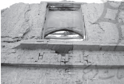
تصویر ۴- نمایی از بالاخانه سنتی خانه ای در محله چال میدان.

عمق آن حدود ۰/۵ متر و در خانه ها بیشتر مستطیل شکل و دارای ابعادی در مقیاس انسانی بود (سلطان زاده، ۱۳۷۱، ۱۲۸)؛ البته در مواردی، درهای کوتاه نیز دیده می شد، اما آستانه بلند پای در ۲ که گذرنده را وادار به پاییندن پیش پای خود می کرد، خطر اصابت سر به آن را تا حدی از بین می برد. این درها معمولاً چوبی و دو لنگه بود ۳ و هیچ لولایی در آنها تعبیه نشده بود، بلکه روی پاشنه می چرخید ۴ . روی در، گلمیخ های فلزی (با اشکال متنوع) و دوکوبه به شکل های گوناگون - هر کدام بر روی یک لته در - نصب می شد که کارکرد آنها، اطلاع رسانی برای حفظ محرمت بود. گاهی نیز در قسمت داخلی در، چفت و کلون به کار می رفت که مقاومت در را تکمیل می کرد (ابوالقاسمی، ۱۳۸۴، ۱۲۳). این درها معمولاً فاقد روزن بود، اما در مواقعی که نور کافی برای هشتی تأمین نمی شد، در بالای در، روزنی کوچک قرار می گرفت (سلطان زاده، ۱۳۷۲، ۱۰۲) تا نور معبر را به درون هشتی هدایت کند. سردر خانه ها یا کاملاً ساده بود و یا تزیینات کم مایه ای از آجرکاری، گچبری یا تلفیقی از آنها را بر سطح خود داشت که این تزیینات نیز متناسب با وضعیت و موقعیت اجتماعی و به فراخور حال صاحبخانه بود. اورسل در این باره می نویسد: «اگر صاحبخانه به زیارت مکه توفیق یافته بود تصویر درختان سرو را بالای سردر خانه اش گچبری می کرد و مردم از این تصاویر می دانستند که اینجا خانه یک حاجی است» (اورسل، ۱۳۵۳، ۱۱۷). بر سطح سردر، کتیبه های