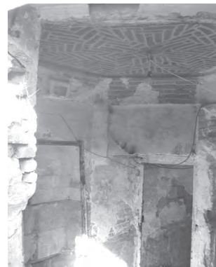
تصویر ۵- فضای هشتی و ورودی دالان خانه ای سنتی در محله عودلاجان.