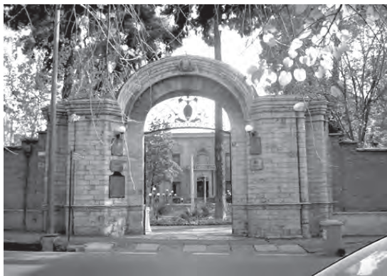
تصویر ۱۴- نمایی از ورودی اروپایی خانه قوام السلطنه واقع در حاشیه خیابانی در محله دولت.

فضای ورودی خانه های سبک اروپایی - مخصوصاً آنهایی که در کنار خیابان ها قرار می گرفتند - در میان یکی از جبهه های اصلی بنا و روی محور تقارن، طراحی و ساخته می شد، اما باز شدن پنجره هایی که معمولاً در یک سمت ورودی یا در دو سوی ورودی ولی با فاصله هایی مختلف از آن یا با اختلاف عددی قرار می گرفتند، تا حدودی این اصل تقارن را به هم می ریخت. دیوار خانه ها، آجری و گاه کوتاه تر از دوره های قبل بود و فضای ورودی در درگاه، در - معمولاً با ترکیباتی چون روزن و پنجره - سردر (گاه بدون سردر) و در مواردی راهرو خلاصه می شد و از دیگر اجزاء و عناصر ورودی مانند پیشطاق، سکو، کوبه، هشتی و دالان - که بیانگر سلسله مراتب ورود، نشان دهنده درونگرایی خانه ها و تأمین کننده محرمت و امنیت بودند - در آنها خبری نبود؛ بدین ترتیب در خانه ها مستقیماً به داخل حیاط یا فضای اصلی خانه گشوده می شد و نحوه ورود کاملاً مستقیم بود (تصویر ۱۴).