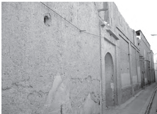
تصویر ۱- دیوارهای بلند و ساده خانه ای سنتی واقع در حاشیه معبری باریک در محله چال میدان.