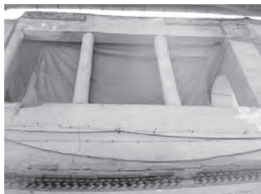
تصویر ۱۱- بالاخانه ستوندار خانه ای تلفیقی در محله بازار.

در مورد سردر و پیشطاق باید گفت که تزیینات آنها، رابطه نسبتاً مستقیمی با وضعیت اقتصادی، موقعیت اجتماعی، روحیه مذهبی و سلیقه صاحبخانه داشت. خانه ها دارای هشتی و دالان (گاه هشتی و دالان به صورتی مجزا) و یا تنها یک راهرو بودند. هشتی دارای تزییناتی متنوع تر از گذشته بود و سقف آن، گاهی ساده و آجری بود و گاه با تیرهای چوبی، یک لایه گچ یا کاربردی های آجری و گچی پوشیده می شد. دالان نیز در بیشتر خانه ها با همان عملکرد پیشین خود باقی ماند، اما در برخی موارد، پوشش روی دالان را برداشته و آن را تبدیل به راهرو کرده اند (تصاویر ۱۲ و ۱۳).