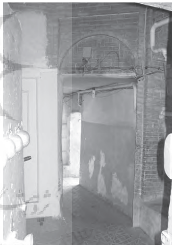
تصویر ۱۲- نمایی از هشتی سکودار و دالان خانه ای تلفیقی در محله سنگلج.

در مورد سردر و پیشطاق باید گفت که تزیینات آنها، رابطه نسبتاً مستقیمی با وضعیت اقتصادی، موقعیت اجتماعی، روحیه مذهبی و سلیقه صاحبخانه داشت. خانه ها دارای هشتی و دالان (گاه هشتی و دالان به صورتی مجزا) و یا تنها یک راهرو بودند. هشتی دارای تزییناتی متنوع تر از گذشته بود و سقف آن، گاهی ساده و آجری بود و گاه با تیرهای چوبی، یک لایه گچ یا کاربردی های آجری و گچی پوشیده می شد. دالان نیز در بیشتر خانه ها با همان عملکرد پیشین خود باقی ماند، اما در برخی موارد، پوشش روی دالان را برداشته و آن را تبدیل به راهرو کرده اند (تصاویر ۱۲ و ۱۳).