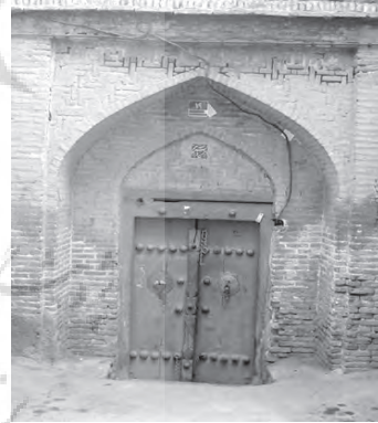
تصویر ۳- ورودی سنتی خانه ای در محله عودلاجان.