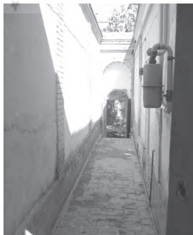
تصویر ۱۳- راهروی ورودی خانه مؤمنن الاطباء در محله عودلاجان.