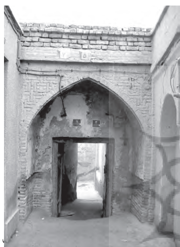
تصویر ۲- میدان.

ورودی خانه های سنتی دارای اجزاء و ترکیبات تقریباً واحدی چون پیشطاق، سکو، درگاه، در - به همراه اجزایی چون آستانه، کوبه، کلون، گلمیخ و گاهی روزن - سردر، هشتی و دالان بود که این اجزاء و عناصر نه تنها امکان دیدار، گفتگو، توقف، انتظار و ورود را فراهم می کرد، بلکه واردشوندگان را بر حسب جنس (زن یا مرد)، کیفیت حضور (حضور در شب یا روز، در خواب یا بیداری، در هنگام استراحت یا زمان کار، در تنهایی یا جمع، در زمستان یا تابستان، در کنار طبیعت یا دور از آن) و رابطه آنها با خانواده (رابطه فردی یا جمعی، شخصی یا اجتماعی، کوتاه مدت یا درازمدت) به فضاهای مختلف خانه هدایت می کرد (هاشمی، ۲۰۱۳۷۵). پیشطاق خانه ها معمولاً به شکل جناغی و گاه به صورت بیضی یا هلالی بود و سقف آنها اغلب ساده و یا با کاربندی های آجری و گچی تزیین می شد. سکوه های آجری یا سنگی دو سوی پیشطاق، حالتی نیمه خصوصی داشت، زیرا هم هنگام گفتگوی صاحبخانه با همسایه ها یا مراجعین با اهالی خانه، از آن استفاده می شد و هم هنگام انتظار و رفع خستگی، بدون کسب اجازه از صاحبخانه، مورد استفاده مراجعان یا عابران قرار می گرفت و این کار، یکی از الگوهای رفتاری و عادات بارز مردم آن زمان محسوب می شد (میرزایی و دیگران، ۱۳۸۵، ۱۹۰). اندازه درگاه خانه ها معمولاً ۱/۵ متر و