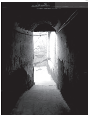
تصویر ۶- دالان مستقیم خانه ای سنتی در محله چال میدان.