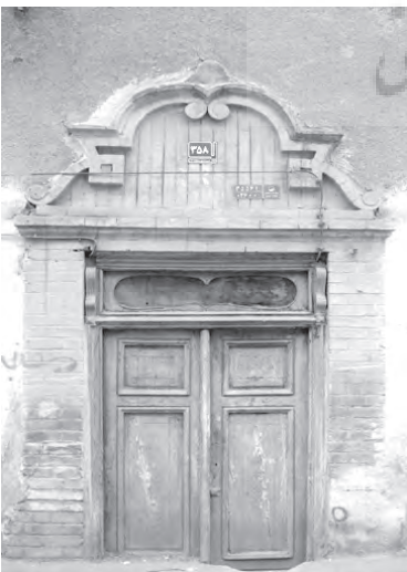
تصویر ۱۰- سردر سنتوری خانه ای به سبک تلفیقی در محله عودلجان.