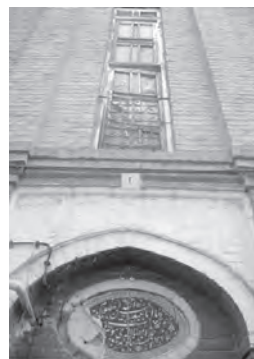
تصویر ۱۹- بخشی از نمای ورودی خانه اروپایی محله چال میدان.

خانه های اروپایی محله سنگلج، بدون سردر و یا دارای سردری ساده و گاه سنتوری شکل و کتیبه دار هستند و عناصری چون پنجره، ستون و در موارد معدودی طاقنما، در فضای آنها به چشم می خورد. بعد از درب ورودی این خانه ها اغلب راهرو قرار دارد (جدول ۲، شماره های ۲۶-۲۸).