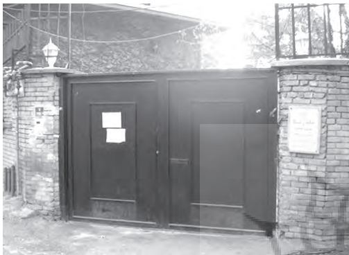
تصویر ۱۷- خانه اروپایی رهنما واقع در منطقه نیاوران.