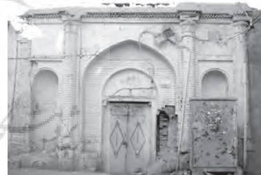
تصویر ۷- نمایی از ورودی خانه ای تلفیقی واقع در حاشیه معبری فرعی در محله بازار.

نمای خانه های تلفیقی، بیشتر از آجر و ورودی آنها دارای عناصری مانند پیشطاق (گاهی بدون پیشطاق)، سکو (گاه فاقد سکو)، درگاه، در - با روزن و گاهی کوبه و کلون - سردر، هشتی (زمانی بدون هشتی)، دالان (گاه بدون دالان) یا راهرو بود. عمق ورودیها معمولاً در حدود ۰/۵ متر، عرض آنها بین ۳ تا ۴ متر و ارتفاع آنها بین ۳ تا ۴/۵ متر بود (سلطان زاده، ۱۳۷۱، ۴۴، ۱۳۴). پیشطاق بیشتر خانه ها، هلالی شکل و دارای تزیینات آجر یا کاشی بود. گاهی اوقات نیز در طرفین پیشطاق، دو طاقنما، دو ستون یا نیم ستون تزیینی و دو سکو قرار می گرفت که اغلب اوقات این سکوها، سطح کافی برای نشستن نداشت و تنها برای ایجاد ترکیب شکلی و فضایی با به عنوان عنصری تزیینی به کار می رفت (تصاویر ۷ و ۸).