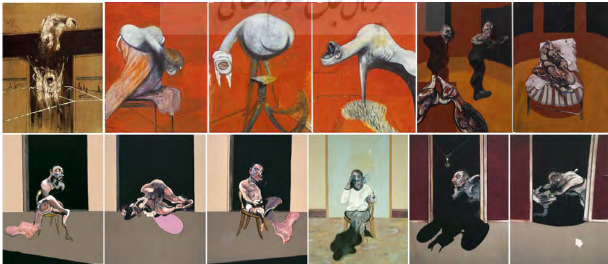
تصویر ۳- نمونه‌های کاربردی برای برهم‌نهش مضمونی.