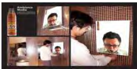
تصویر ۲- سس تند ولف / بدون تاریخ.