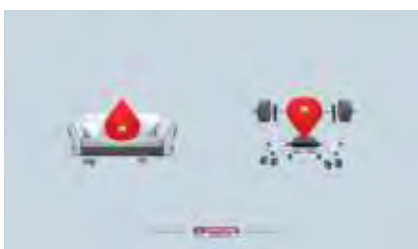
تصویر ۶- آژانس تبلیغاتی جئومتري گلابل، اسپرت لایف / ۲۰۱۵.

همانطور که اشاره شد، روش تحلیل بصری در این تحقیق، روش پیشنهادی پهلوان (۱۳۸۴ و ۱۳۸۷) است. از این رو مفاهیم به‌کار رفته در دسته سؤالات ساحت شمالی بدین شرح است: منظور از دسته‌بندی انواع پوستر، تقسیم‌بندی پوسترها به سه دسته است. پوسترهای شمالی، آن دسته آثاری هستند که فقط شمایل دارند. پوسترهای نوشتاری، به آثاری که تنها با نوشتار ارائه شدند و تلفیقی به آثاری گفته شد که علاوه بر شمایل، دارای نوشتار هم هستند. در اولویت عنصر، منظور کمیت فضای اشغال شده توسط شمایل یا نوشتار در سطح آگهی است. نوع شمایل که خود به دو گروه شمایل‌های فیگوراتیو و تجریدی-نموداری تقسیم شده است. فیگوراتیو به آن دسته از نشانه‌های شمالی اطلاق شده است که دارای شباهت