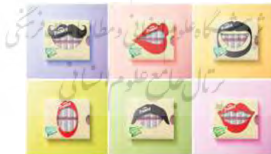
تصویر ۱- دواجی، بسته‌بندی آدامس تری‌دنت / ۲۰۱۴.

یکی از مهم‌ترین نکات در طراحی گرافیک، به ویژه در طراحی آرم و آرم‌نوشته، که باعث ماندگاری بیشتر اثر در ذهن‌ها می‌شود، ایجاد و ساده‌گویی است. یکی از راه‌های رسیدن به سادگی در طراحی آرم استفاده از جناس‌های بصری است. لوبالین ۳۳ را می‌توان از پیش‌تازان استفاده از جناس‌های بصری در طراحی آرم دانست. از مشهورترین این نمونه‌ها آرم مجله مادر و کودک ۳۴ است. در این آرم‌نوشته، شکل خلاصه‌شده‌ای از جنین در فضای داخلی حرف O با کارکردی دوگانه (شمایل جنین و فرازبان &) در میان واژه مادر قرار داده شده است (تصویر ۲). یکی از بیشترین نموده‌های جناس بصری را در طراحی تبلیغات محیطی شاهدیم. به‌طور معمول طراحان حوزه تبلیغات محیطی، با انتخاب بخشی از محیط داخلی یا خارجی، مثلاً درب وسایل نقلیه، ساختمان‌ها و غیره، طرح‌های خود را با این اماکن مرتبط می‌کنند و از آنها به‌عنوان بخشی از طرح استفاده می‌کنند. کمپانی ولف ۳۵ برای معرفی سس تند خود، با طراحی برچسب و نصب آن بر روی خشک‌کن سرویس بهداشتی، تندی محصولش را با عملکرد دستگاه خشک‌کن دست یکی دانسته است (تصویر ۳). استفاده از جناس‌های بصری تام در طراحی پوستر اگر به اندازه کاربرد آنها