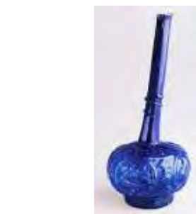
تصویر ۲- صراحی شلجمی ساده. مأخذ: (Carboni & Whitehouse, 2001: 92)

جدول ۱- انواع فرم صراحی و ترسیم خطی بدنه آن.