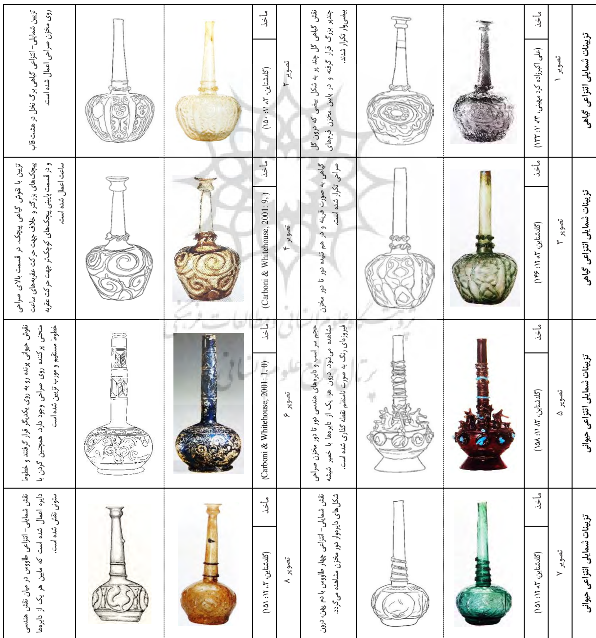
جدول ۲- تزیینات شمایی- انتزاعی صراحی‌های شیشه‌ای و ترسیم خطی آن.