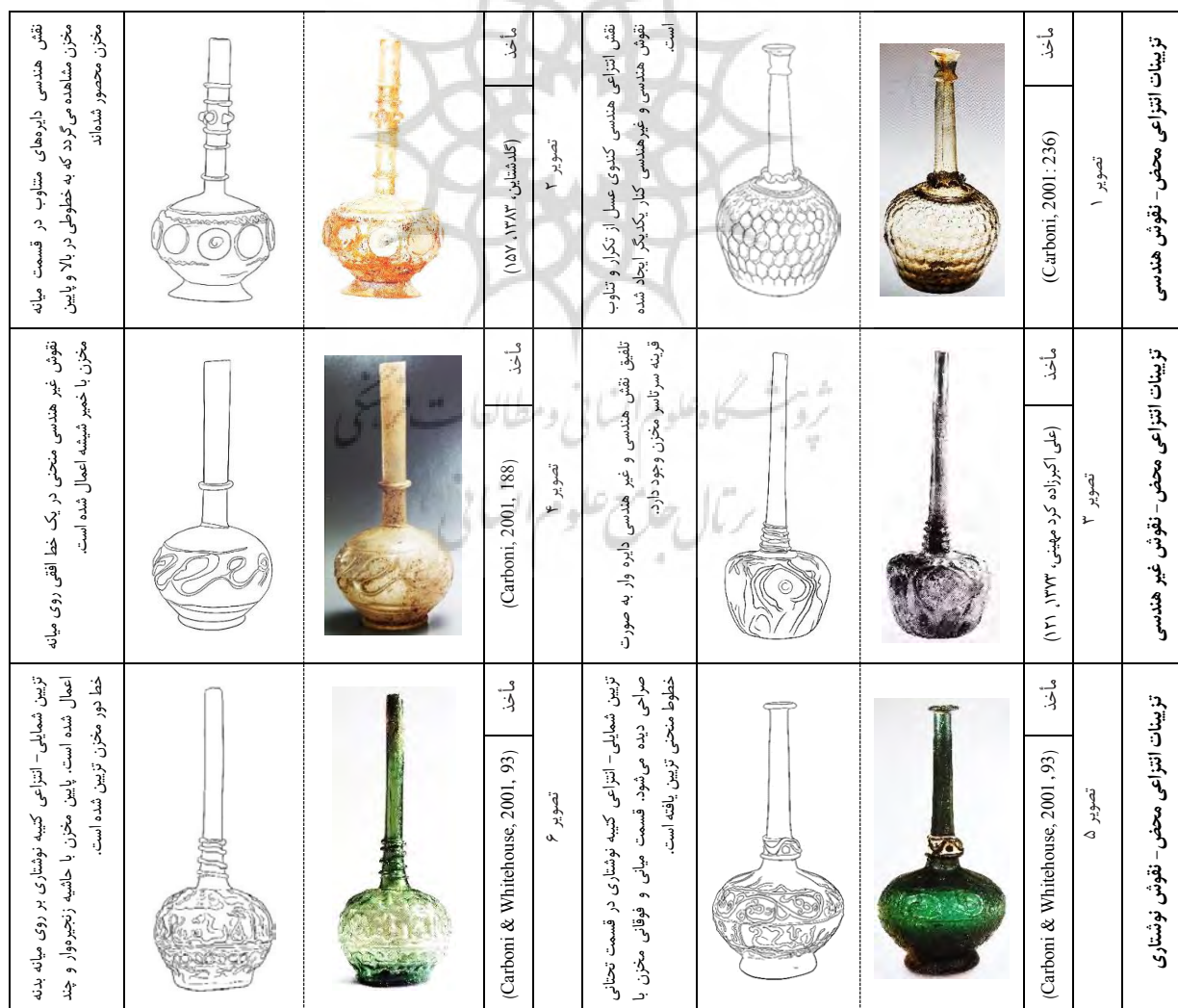
جدول ۳- تزئینات انتزاعی محض صراحی‌های شیشه‌ای و ترسیم خطی آن.

نقوش حیوانی: از جمله نقوش حیوانی بر روی این صراحی‌ها نقش پرند است که نه به صورت مجرد، بلکه در میان تزئینات هندسی نقش شده است. در میان نقوش حیوانی طرح طاووس شاخص است که کیفیت انتزاعی در طراحی این طاووس‌ها وجود دارد. همچنین در صراحی (تصویر ۵) فرم سر اسب دورتا دور صراحی اعمال شده است.