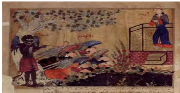
تصویر ۱۴- سجده فرشتگان بر آدم و شیطان در حال تماشا، تفسیر طبری، موزه توپقاپی سرا، استانبول. مأخذ: (Sims, 2000, 264)