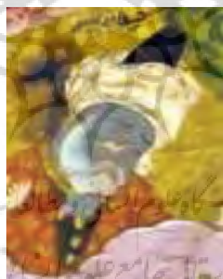
تصویر ۸- بخشی از نگاره آدم و حوا در بهشت.