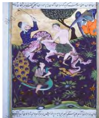
تصویر ۱۱- خروج آدم و حوا از بهشت، فالنامه، موزه توفیایی سرا، استانبول.