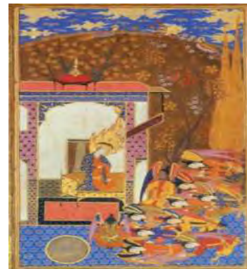
تصویر ۱۰- سجده فرشتگان بر آدم، حبیب‌السیر، مجموعه کاخ گلستان.