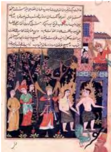
تصویر ۳- خروج آدم و حوا از بهشت، کتابخانه ملی جروسالن.