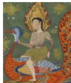
تصویر ۴- بخشی از نگاره آدم و حوا در حال خروج از بهشت.

یکی دیگر از جانورانی که همکار شیطان شناخته شده، طاووس است. معنای سمبلیک طاووس به معنی تزیینات، تجمل، تکبر، فناپذیری، غرور دنیوی و... است و در باورهای قومی و اساطیری نابودکننده مار است (دادور و منصور، ۱۳۸۵، ۱۱۴). در برخی از آیین‌های کهن یک جفت طاووس در دو سوی درخت مقدس قرار دارد که گاهی ماری را در منقار گرفته است. از معنای سمبلیک آن این‌طور می‌توان تعبیر نمود که این پرنده هم‌معنای منفی و هم‌معنای مثبت دارد. در ادیان سامی همان‌طور که در داستان آدم و حوا در تورات و انجیل بیان شد، طاووس یکی از موجوداتی است که به شیطان برای پیشبرد هدفش کمک می‌کند. در فرقه یزیدیه نیز طاووس نماد شیطان است (یاحقی، ۱۳۸۶، ۵۵۴). این موضوع که طاووس در این فرقه نماد شیطان است به داستان اهریمن در آیین مهرپرستی می‌رسد. در این آیین اهریمن برای اثبات اینکه می‌تواند چیزهای نیک بیافریند، طاووس را به‌عنوان یکی از زیباترین پرندگان می‌آفریند. بر همین اساس طاووس نماد اهریمن و شیطان است و در فرقه یزیدیه نیز از این پرنده برای نشان دادن شیطان استفاده می‌کنند (اکبری مفاخر، ۱۳۸۵، ۹۷). در نگاره‌ها نیز بر اساس آنچه در تفاسیر اولیه قرآن کریم آمده مانند تفسیر طبری که تحت تأثیر روایات یهودی بوده، نگارگر این حیوان را به‌عنوان همکار شیطان تصویر نموده است. در برخی از تعبیر عرفانی از داستان آدم و حوا طاووس را نماد شهوت و حوا را جسم می‌دانند (یاحقی، ۱۳۸۶، ۵۵۵). بر مبنای این تفسیر می‌توان این‌گونه استنباط نمود که (تصویر ۴) که حوا را سوار بر طاووس نشان داده نشانگر رابطه شهوت و جسم است. عطار در منطق‌الطیر، طاووس را مظهر بهشت پرستان می‌داند