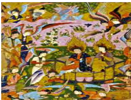
تصویر ۶- سجده فرشتگان بر آدم و حوا در بهشت، فالنامه، مکتب قزوین، گالری فریر، واشینگتن.

همکار شیطان (تصویر ۳) ریشه در اسطوره‌های کهن دارد و چه در اسطوره گلگمیش و چه در روایات و کتب مقدس و حتی در معنای شیطان در زبان عربی، تصویر شیطان با این موجود رابطه تنگاتنگی دارد. نکته قابل تأمل در اینجا مثبت بودن معنی مار و رابطه آن با الهه‌هاست و در نهایت تبدیل به موجودی منفی شدن است که به نظر می‌رسد تغییر و چرخش معنای نمادین مار از مثبت به منفی به عبور از مرحله مادر سالاری به مرحله پدرسالاری مربوط است و به همین دلیل این نماد جایگزین نماد اهریمن و شیطان شده است.