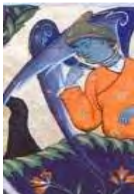
تصویر ۱۲- بخشی از نگاره خروج آدم و حوا از بهشت