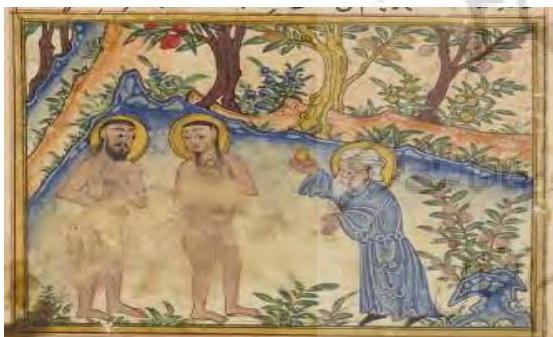
تصویر ۵- مشی و مشیانه، آثارالباقیه بیرونی.

قرآن کریم در سوره کهف آیه ۵۰، شیطان را از جنس جن می‌داند. همچنین در سوره مریم آیه ۱۷ و سوره الذاریات آیه ۲۴، به تجسم و به صورت درآمدن جنیان و فرشتگان به شکل انسان پرداخته است. این موضوع نشانگر این مطلب است که شیطان نیز که از جنس جن است می‌تواند در ظاهر انسان نمایان شود. در شأن نزول آیه ۳۰ سوره انفال آمده است که گروهی از قریش و اشراف مکه جمع شدند و درباره خطری که از ناحیه پیامبر اکرم (ص) آن‌ها را تهدید می‌کرد، چاره‌ای بیندیشند و باهم مشورت کنند، در هنگام مشورت ابوجهل گفت: از هر قبیله‌ای جوانی شجاع انتخاب کرده و به دست هر یک شمشیر برنده‌ای می‌دهیم که دسته‌جمعی او را به قتل برسانند. در این هنگام شیطان که به صورت پیرمردی از اهل نجد در بین آن‌ها ظاهر شده بود، گفت: نظر این جوان، ابوجهل بهتر است، پس سریعاً اقدام به چنین کاری بنمایید (علامه طباطبایی، ۱۳۷۸، ۱۰۳). در روایتی از امام رضا (ع) از پدران گرامی خود، آمده است: روزی نزدیک کعبه نشسته بودم، ناگهان پیرمردی را دیدم گوشت که از شدت پیری ابروهای او بر روی چشمش افتاده، عصایی در دست، کلاه سرخی بر سر و لباس پشمینه‌ای بر تن، نزدیک پیغمبر اکرم (ص) آمد و عرض کرد: یا رسول‌الله (ص)! دعا کن تا خداوند مرا بیمارزد. رسول خدا (ص) فرمودند: ای پیرمرد سعی و کوشش تو بی‌ثمر و