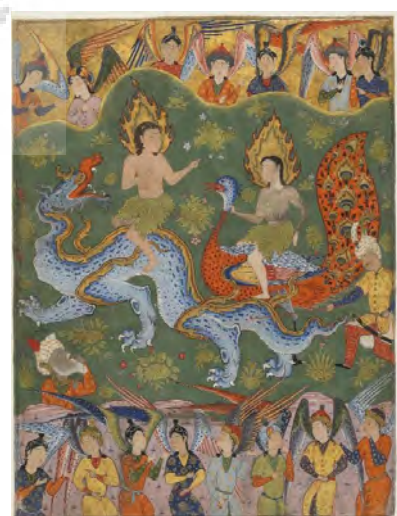
تصویر ۱- آدم و حوا در حال خروج از بهشت، فالنامه، مکتب تبریز یا قزوین، گالری ساکر، واشینگتن.