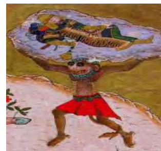
تصویر ۱۳- بخشی از نگاره نبرد رستم و اکوان دیو، شاهنامه محمد جوکی.

جدول ۱- تطبیق بازنمایی‌های شیطان با متون اساطیری، ادیان، تفاسیر و روایات و متون ادبی و عرفانی.