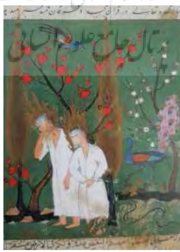
تصویر ۲- خروج آدم و حوا از بهشت، قصص الانبیاء، کتابخانه چستر بیوتی، دوبلین.