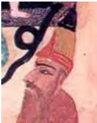
تصویر ۹- بخشی از نگاره خروج آدم و حوا از بهشت.

عمل و خواسته تو بی‌فایده است. پیرمرد از آنجا رفت و پیامبر(ص) فرمودند: یا ابوالحسن! اوشیطان لعین بود(کامرانیان، ۱۳۸۷، ۱۸۵). همچنین ابلیس با صورت مرد ظاهر می‌شود زیرا درباره جنسیت ابلیس، امام صادق(ع) فرمودند: ابلیس و فرزندان آن از نسل «مارج» و «مارجه» هستند و ابلیس با زنی به نام «لهیا» از طایفه جن ازدواج کرد(کامرانیان، ۱۳۸۹، ۲۵۹). بر اساس این روایت ابلیس مذکر است. همچنین بیرونی نیز در کتاب آثارالباقیه درباره افسانه کیومرث و مشی و مشیانه این‌گونه بیان می‌کند که مشی و مشیانه از خوراک و آشامیدنی بی‌نیاز بودند تا اینکه اهریمن به‌صورت پیرمردی در آمد و آنان را به خوردن میوه‌ها برانگیخت(بیرونی، ۱۳۸۶، ۱۴۲)(تصویر ۵). در(تصاویر ۷، ۸ و ۹) شیطان به‌صورت یک پیرمرد بازنمایی شده و یکی از دلایل آن می‌تواند روایاتی باشد که در بالا ذکر شده و تجسم شیطان به‌صورت پیرمرد شرح داده‌شده است. شاید بتوان یکی دیگر از دلایل انتخاب پیرمرد در تصاویر را مفهوم کهن‌الگوی پیر فرزانه دانست و آن را با دیدگاه عارفانی چون حلاج که برای شیطان جایگاه و مقام والا قائل‌اند هم‌داستان دانست، زیرا از دیدگاه این عرفا شیطان نه تنها کافر و یاغی نیست بلکه موحدی بزرگ و استادی است که قدرت اختیار را به انسان آموخت و عاشقی واقعی که عشق به معبود را باید از وی آموخت(حسینی کازرونی و توسلی، ۱۳۹۰، ۹۰). این نوع نگاه مثبت به شیطان می‌تواند آن را در مقام پیر فرزانه قرار دهد. پیر فرزانه یکی از کهن‌الگوهایی است که یونگ به آن اشاره دارد و در