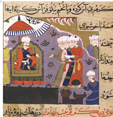
تصویر ۶- طرز تهیه سوپ و ادویه کاری. (Titley, 2005, 44)