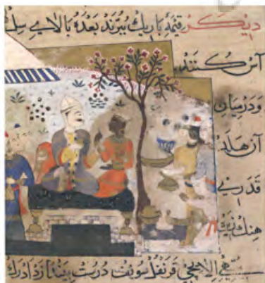
تصویر ۷- طرز تهیه کوفته. (Titley, 2005, 90)

شاه به همراه ملازمان در زیر سایه بان نشسته است. زن در کنار سلطان هند با گوشواره ای آویز نشسته است. در سمت راست سلطان تعدادی خدمه با چهره ایرانی در حال پذیرایی و خدمت به وی هستند. دو زن در حال آشپزی بر روی زمین نشسته و دستور طبخ شربت و حریره را نوشته‌اند. در این نگاره نیز حکومت هند و دربار سلطان غیاث‌الدین به عنوان یک فضای نشانه‌ای در مواجهه با یک نوع غذای ایرانی که از مرز نشانه‌ای عبور کرده و به فضای درون وارد شده است، آن را ضمن سازوکار ترجمه، از طریق استفاده از سبک طبخ ایرانی، مورد جذب قرار می‌دهد.