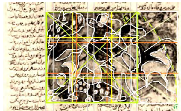
تصویر ۱۲- بخشی از تصویر ۱۱، مربع شاخص و گسترش آن از هر طرف به اندازه‌ی رادیکال ۲ و ترسیم خطوط طلایی در کادر مربع.