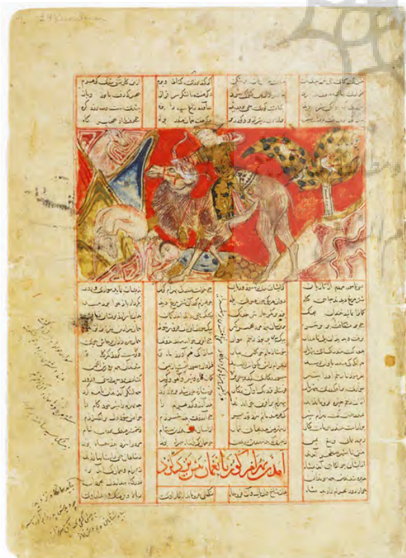
تصویر ۱۳- بهرام گور و آزاده در شکارگاه، شاهنامه ۵۷۵۳ ه.ق.، شیراز.