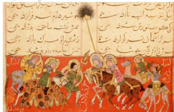
تصویر ۱- لشکر ورقه، سپاه بحرین و عدن را متفرق می‌کند، اوایل قرن ۷ ه. ق. برگ ۲۸/۳۶b.

به نظر می‌رسد کهن‌ترین شاهنامه‌ی جهان به لحاظ دوره‌ی تاریخی با نسخه‌ی ورقه و گلشاه ۲ همزمان بوده، چرا که هر دو نسخه دارای عناصر سبکی مشابهند، و این مطلب می‌تواند سندی مبنی بر تعلق شاهنامه‌ی کاما بر دوره‌ی سلجوقی باشد. صحنه‌هایی از این نسخه‌ی خطی منظوم و عاشقانه با