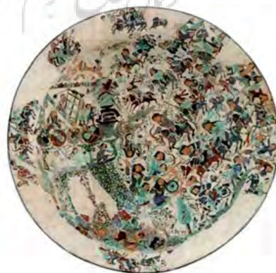
تصویر ۶- بشقاب سرامیکی با موضوع «تصرف یک دژ»، اوایل قرن ۱۳ م.