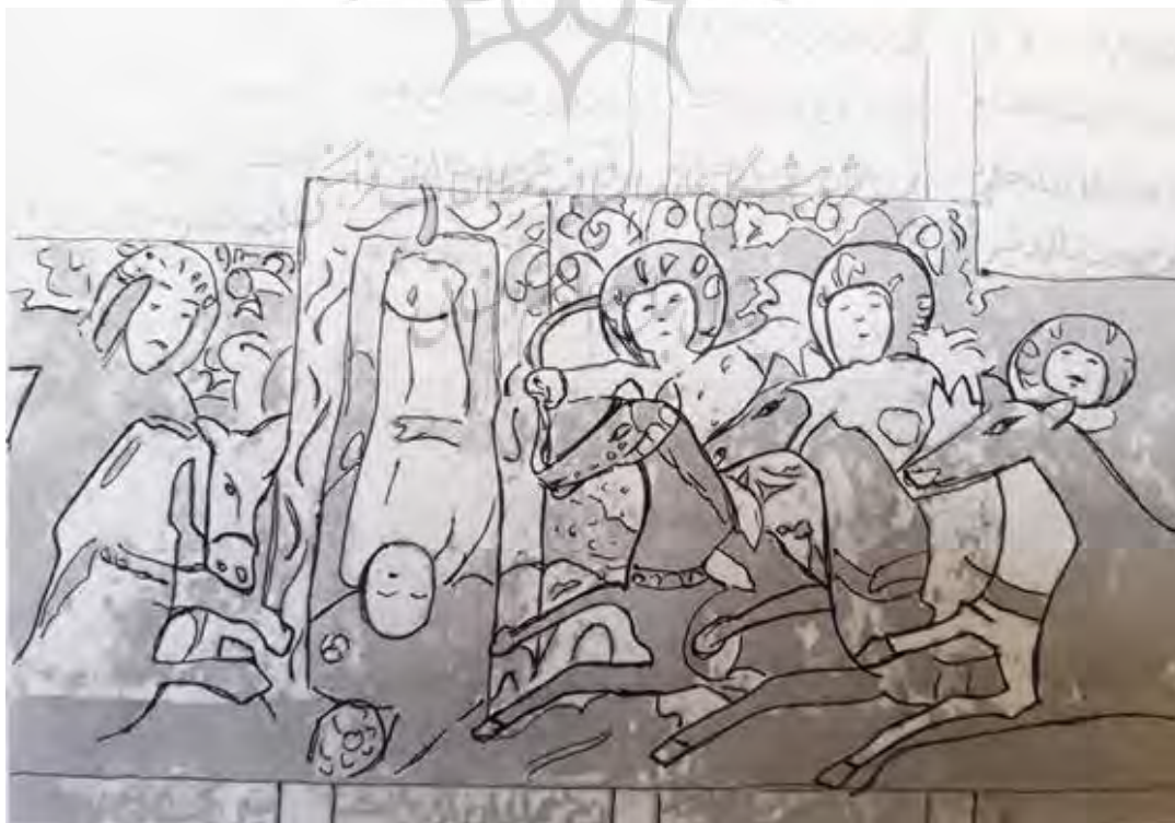
تصویر ۳- دار زدن اردشیر پور رستم را، شاهنامه‌ی کاما، اوایل قرن ۷. ماخذ: (معرفی نسخه‌های شاهنامه‌ی فردوسی، ۱۳۶۹؛ آنالیز خطی: نگارندگان)

خط ورقه و گلشاه به نسخ آناتولی شباهت دارد، چون اولاً، خط آن نسخ ساده و به خط محقق شبیه است. دوم، انتهای حروف راء، زاء و نون مانند شاهنامه‌های اینجو به سمت بالا کشیده