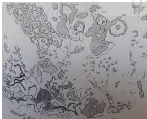
تصویر ۷- بخشی از تصویر شماره‌ی ۶ که در سمت چپ پایین آن، تپه‌هایی دو بعدی با خطوط پهن و مضرتی را نشان می‌دهد. آنالیز خطی؛ نگارندگان

رنگ‌مایه‌های رقیق به‌کار رفته در بشقاب، در نگاره‌های ارایه‌شده از شاهنامه‌ی کاما نیز مشهود است. رنگ‌ها در شاهنامه‌ی کاما، آبرنگی و بدون جسمیت به نظر می‌آیند و لایه‌های متعدد رنگی به لحاظ رقیق و شفاف بودن، نمودی کاملاً عینی دارد. بهره‌گیری از رنگ‌مایه‌های رقیق، ویژگی‌ای است که تداوم آن را در نگاره‌های مکتب شیراز اینجو همچنان شاهدیم (تصاویر ۹ و ۱۳). نیز نقشمایه‌ی تپه‌های مثلثی شکل با خطوط پهن دوری موجود در بشقاب سلجوقی را در شاهنامه‌های اینجو می‌بینیم. البته در مکتب اینجو، شاهد کوه‌های بلند کشیده و مثلثی شکل با چند خط پیرامونی و با رنگ‌های رقیق و غلیظ هستیم که برخی