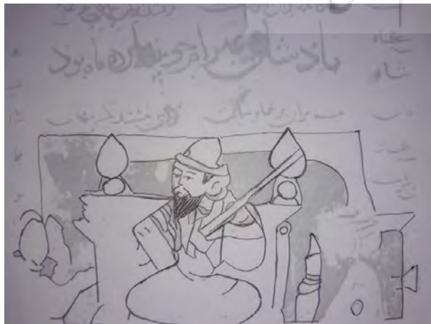
تصویر ۴- پادشاهی بهرام چوبینه پانزده ماه بود. شاهنامه‌ی کاما، اوایل قرن ۷ هجری. ماخذ: (همان، ۱۳۶۹، نوزده؛ آنالیز خطی: نگارندگان).

همان‌گونه که به قول پاکباز، قرابتی آشکار میان ۷۱ نگاره‌ی نسخه‌ی ورقه و گلشاه با تصاویر ظروف مینایی از حیث شیوه‌ی چهره‌نگاری، نقش‌پردازی و ترکیب‌بندی به چشم می‌خورد (پاکباز، ۱۳۸۳، ۷۶)، این قرابت میان نقشمایه‌ها، پیکره‌ها و عناصر منظره در شاهنامه‌ی کاما با نقوش سفالینه‌های سلجوقی نیز دیده می‌شود. در اینجا، آدم‌ها و جانوران و گیاهان با خطوط شکل‌ساز