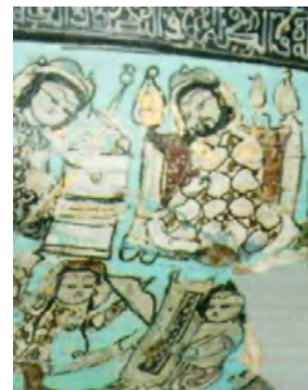
تصویر ۵- بخشی از جام مینیایی شکسته با صحنه‌ای از داستان فریدون، اواخر قرن ۶ یا قرن ۷ هجری.