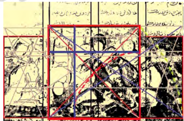
تصویر ۸- نقش ستون‌های عمودی فرضی متن نوشتاری و مماس شدن آنها بر نقشمایه‌های کلیدی داستان. مربع شاخص و نسبت \sqrt{2} و خطوط و نسبت‌های طلایی در کادر مربع مادر یا شاخص از تصویر ۳.

تصویر ۸، از نظام‌های قراردادی و هندسه‌ی پنهان اثر سخن می‌گوید و اثبات می‌کند که نگارگر سلجوقی، به علم هندسه، تناسبات و مربع شاخص و اهمیت آن در تصویر، وقوف کامل داشته است. اساس ترکیب بندی این نگاره بر مربعی است که از دو طرف به اندازه‌ی قطر مربع شاخص که برابر با \sqrt{2} است، گسترش یافته است. مربع شاخص، «مادر ترکیب» است و محمل اندیشه‌ی هنرمند. این مربع در کادر مستطیل، محل استقرار عنصر اصلی ترکیب است. عنصری که هدف ترکیب را مشخص می‌کند و سبب تمرکز نگاه در اثر می‌شود و از آنجا به سایر بخش‌های ترکیب رهنمون می‌شود (آیت‌اللهی، ۱۳۶۳، ۱۱۸). حالت پلکانی بالای تصویر نیز بر حضور این مربع مادر تأکید بیشتری می‌کند. ترسیمات داخل مربع زاینده از سوی نویسندگان به وضوح مشخص نمود که طراح اثر کاملاً از تقسیمات درون مربعی بر اساس نسبت \sqrt{2} آگاه بوده است، چرا که خطوط ترسیم شده بر اساس این نسبت طلایی دقیقاً منطبق بر چوبه‌ی دار است، که مهم‌ترین نقشمایه‌ی آیکونیک داستان است و می‌توان آن را رمزگشایی کرد و پایه‌ی دیگر چوبه‌ی دار منطبق بر ستون سمت چپی است که در امتداد فرضی ستون عمودی بین خطوط متن است. خط طلایی افقی نیز دقیقاً منطبق بر چهره‌های اردشیر و همراهان اوست. ۱۳