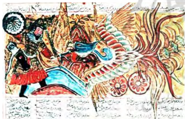
تصویر ۹- جنگ اسفندیار و سیمرغ، شاهنامه ۷۳۱ ه. ق مکتب شیراز. ماخذ: آژند، ۱۳۸۷، ۸۹.

۱. «جنگ اسفندیار با سیمرغ» از شاهنامه‌ی ۷۳۱ ه. ق شیراز اینجو یکی از صحنه‌های حضور سیمرغ در شاهنامه‌ی فردوسی، هفت خوان اسفندیار است. در خوان پنجم، اسفندیار باید سیمرغ را بکشد. در تصویر ۹، این داستان و نقطه‌ی اوج آن که همانا کشته شدن سیمرغ بدست اسفندیار است، به نمایش درآمده است. در تصویر ۱۰، مربع شاخص کادر، که محمل اندیشه هنرمند است و مضمون اصلی داستان را در خود جای داده، در سمت چپ کادر دیده می‌شود. دو خط عمودی و دو خط افقی طلایی کادر که به رنگ سفید در درون مربع شاخص ترسیم شده‌اند، تقسیمات و نسبت‌های طلایی درون مربعی را نشان می‌دهد. خطوط طلایی