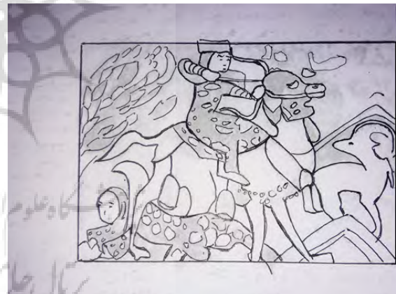
تصویر ۱۱- بهرام گور و آزاده در شکارگاه ۳ ، شاهنامه ۵۷۳۳ ه.ق.، شیراز. مآخذ: (آدامووا و گیوزالیان، ۱۳۸۶، ۱۸۷؛ آنالیز خطی: نگارندگان).

در این صحنه (تصویر ۱۱)، برخلاف نگاره‌هایی که از شاهنامه‌های