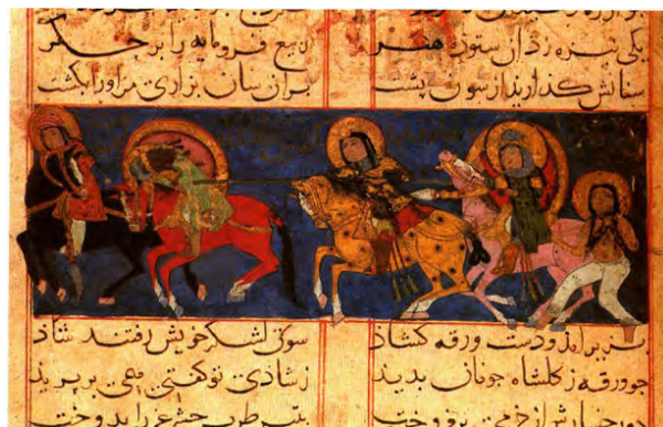
تصویر ۲- کشتن گلشاه، اوایل قرن ۷ ه. ق. نسخه‌ی ورقه و گلشاه. ماخذ: همان)

بدین ترتیب دانسته می‌شود که سبک اویغوری در قرن ۷ م. از آسیای میانه آغاز و در قرن ۱۵ تا شرق نزدیک تداوم یافته است. براساس نتیجه‌گیری گروبه، این سبک به وسیله‌ی ترکان مهاجر به غرب آورده شده و در مراکز جدید سیاسی (غزنین، ری، کاشان، آناتولی، موصل) تداوم یافت (مقدم، ۱۳۸۹، ۱۹-۲۰). اما برخی نیز بر این اعتقادند که این هنر ایران و مظاهر آن بود که قرن‌ها قبل بوسیله‌ی مانویان به آسیای مرکزی آورده شده و به همت اویغورهای این منطقه، تشعشع بیشتر یافته و به وسیله‌ی سلجوقیان به ایران بازگردانده شد و ایشان باعث درخشش هنری ایران در شهرهای اصفهان، ری، بغداد و نیشابور شدند (غروی، ۱۳۵۶، ۶۵). گرچه کمال اوزگین نیز سبک به کار رفته در نگاره‌های نسخه‌ی خطی را «سبک اویغوری که با تیپ‌های اویغوری مشخص و مبرز می‌گردد» می‌داند (مقدم، ۱۳۸۹، ۱۶)، اما ذبیح‌الله صفا در این مورد معتقد است: «تصاویر این کتاب که شماره‌ی آنها به ۷۱ می‌رسد به سبکی است که در قرن ششم و اوایل قرن هفتم متداول بوده