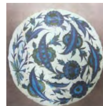
تصویر ۶. بشقاب زیرلعابی به سبک ساز، ایزنیک، ۱۵۵۰، موزه بریتانیا مأخذ: (رایس، ۱۳۷۲: ۶۴۴)