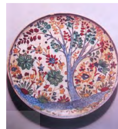
تصویر ۱. تزئین روی ظرف کوباجه

(محمدی فر و بلمکی، ۱۳۸۷: ۹۷) آرتور لین درباره سفال‌های کوباجه می‌نویسد: «این نوع سفال که اکثراً به شکل کاسه و بشقاب لب‌تخت و عمدتاً پایه‌دار است، دارای بدنه متخلخل و ترکیب سفید بسیار ریز و نرم است که با نقوش تزئینی گوناگون، به خصوص گل و برگ‌های طوماری و اسلیمی به رنگ‌های مختلف مانند سیاه، سبز، آبی، اخراپی و قهوه‌ای در زیر لعاب شفاف آراسته گردیده‌اند» (Lane, 1957: 78) (تصویر ۱). اغلب متخصصان، ایران را مبدأ تولید این گونه سفال می‌دانند (رفیعی، ۱۳۷۷: ۵۱).