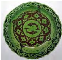
تصویر ۴. ظرف کوباچه با نقش ماهی، ایران، سده ۱۰/۱۶