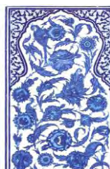
تصویر ۱۰. گل‌های ختایی کار شده توسط شاه‌کولو (شاهقولی) در توپقایی سرای. مأخذ: (Denny, 2004: 154)