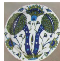
تصویر ۹. ظرف ایزنیک به سبک دمشقی، ۱۵۴۵