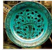
تصویر ۲. ظروف کوباچه با نقوش قلم سیاه، زیر لعاب سبز، موزه بریتیش (قاسمی و شیرازی، ۱۳۹۱: ۷۳) مأخذ:

آجری و زیتونی تیره مایل به سیاه (رفیعی، ۱۳۷۷: ۱۶۹). استفاده از نقوش گیاهی به صورت آزادانه برای متن و نقوش اسلیمی، گل و گاه نقوش متأثر از ظروف چینی برای حاشیه، از دیگر ویژگی‌های این ظروف است.