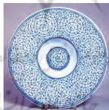
تصویر ۷. ظرف به سبک اسپیرال طغرابی حدود ۳۵-۱۵۳۰