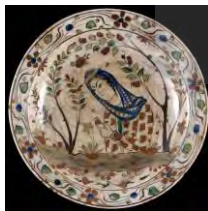
تصویر ۵. بشقاب سفالین کوباچه، ایران، دوره صفوی

آجری و زیتونی تیره مایل به سیاه (رفیعی، ۱۳۷۷: ۱۶۹). استفاده از نقوش گیاهی به صورت آزادانه برای متن و نقوش اسلیمی، گل و گاه نقوش متأثر از ظروف چینی برای حاشیه، از دیگر ویژگی‌های این ظروف است.