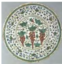
تصویر ۸. تقلید از ظروف چینی، سه خوشه انگور، ایزنیک، ۷۵-۱۵۶۰

در این دوره، از گل‌های طبیعی و گل‌هایی که در ترکی به نام شکوفه شناخته می‌شدند، استفاده بیشتری شد و تنوع رنگی