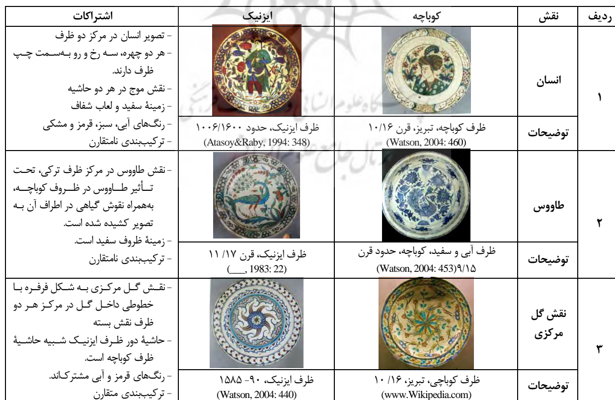
جدول ۱. تطبیق نمونه‌هایی از سفال کوباچه و ایزنیک

شیوه‌های رنگ‌آمیزی ظروف در هر دو منطقه شبیه به هم است. پس از حضور هنرمندان ایرانی در دربار عثمانی، شاهد تنوع تدریجی در رنگ ظروف ایزنیک هستیم که به نظر می‌رسد به کاربردن طیف‌های رنگی بیشتر نسبت به رنگ‌های محدود قبلی، از تأثیرات حضور سفالگران ایرانی در نقاشخانه‌های تحت نظارت دربار و تعلیم شاگردان آنها باشد. ظروف سفالی هر دو منطقه، اغلب دارای زمینه سفید هستند که بر تمام این ظروف، لایه لعاب شفاف شیشه‌ای کشیده شده است. استفاده از رنگ‌های مشترک سیاه، قرمز،