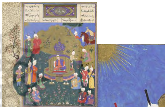
تصویر ۱۷. بزرگمهر به مجلس پنجم نوشیروان نگاه می‌کند؛ شاهنامه شاه طهماسب.

تطبیق خورشید در حمزه نامه و شاهنامه شاه طهماسب