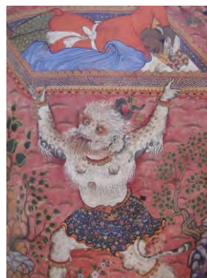
تصویر ۲۳. لندهور خفته توسط دیو ربوده می‌شود؛ حمزه‌نامه. مأخذ: (Seyller, 2002: 95)

تشابه در نگاره حمزه نامه و شاهنامه محمد جوکی