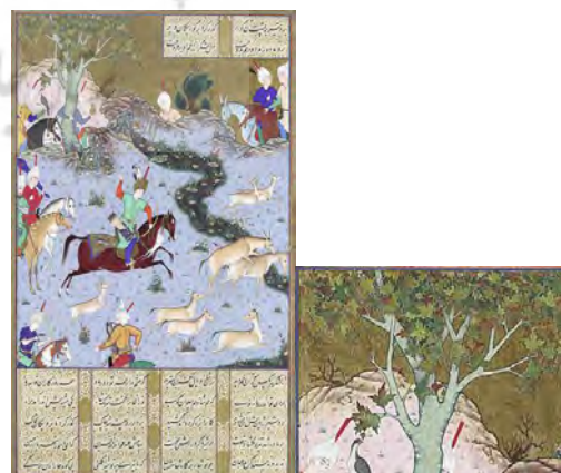
تصویر ۳. بهرام گور یک جفت گور خر را به هم متصل می‌کند؛ شاهنامه شاه طهماسب.