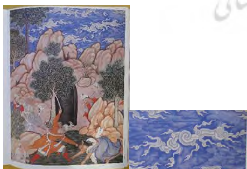
تصویر ۲۰. یک قهرمان اهریمن را می‌کشد؛ حمزه‌نامه.

تطبیق خورشید در حمزه نامه و شاهنامه شاه طهماسب