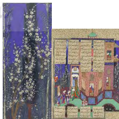
تصویر ۵. دوشیزه رودابه به کاخ بازگشت؛ شاهنامه شاه طهماسب.

تطبیق درخت سرو در حمزه‌نامه و شاهنامه شاه طهماسب