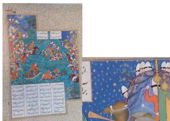
تصویر ۲۱. قارن (کارن) بارمان را کشت؛ شاهنامه شاه طهماسب. مأخذ: (Canby, 2011: 99)