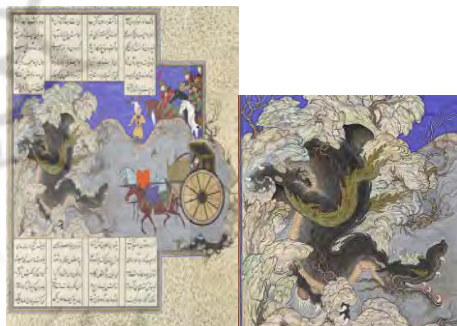
تصویر ۱۱. اسفندیار یک اژدها را می‌کشد؛ شاهنامه شاه طهماسب.

تطبیق اژدها در حمزه‌نامه و شاهنامه شاه طهماسب