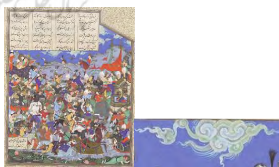
تصویر ۱۹. آغاز نبرد پاشان (pashan)؛ شاهنامه شاه طهماسب.

تطبیق ابر در حمزه نامه و شاهنامه شاه طهماسب