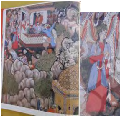
تصویر ۱۶. حمزه با حورا که جن است، صحبت می‌کند؛ در حالی که اژدها نزدیک می‌شود؛ حمزه‌نامه. مأخذ: (Seyller, 2002: 85)

به روشنی تداوم روند شکل‌گیری صورت تصویری فرشته را نشان می‌دهد» (کفشچیان مقدم و باحقی، ۱۳۹۰: ۶۹). از سوی دیگر، در هنر هندی موجودات تلفیقی و اساطیری متعددی دیده می‌شود که ابوالقاسم دادور (۱۳۹۰) در کتاب درآمدی بر اسطوره‌ها و نمادهای ایران و هند در عهد باستان به برخی از آنها اشاره کرده است. همچنین امیرحسین ذکرگو (۱۳۹۳) در کتاب پرنده‌های اساطیری در هنرهای بودایی و هندویی ، به بعضی دیگر از آنها اشاره کرده است که در هیچ یک به پریان یا انسان بال‌دار اشاره‌ای نشده است. بنابراین، با توجه به این مطالب و شباهت پریان، انسان بال‌دار، در نگاره حمزه‌نامه به نمونه ایرانی آن، تأثیرپذیری آن به نگارگری ایرانی دور از ذهن نیست.