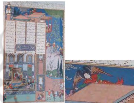
تصویر ۱۵. فریدون در کاخ ضحاک بر مسند نشاندۀ شاه شاهنامه شاه طهماسب.

همچنین نقش انسان بال‌دار در هنر ایران دارای پیشینه‌ای طولانی است؛ از آن جمله در ایوان ورودی پاسارگاد از بناهای هخامنشی، نقش برجسته‌ای از تصویر انسان بال‌دار دیده می‌شود. علاوه بر پریان، فرشته نیز در نگارگری ایرانی به صورت انسان بال‌دار نشان داده می‌شود. فرشته در قدیمی‌ترین نسخه‌های مصور دوره اسلامی دیده می‌شود؛ از جمله در کتاب شمس و پریان ، نقش پری