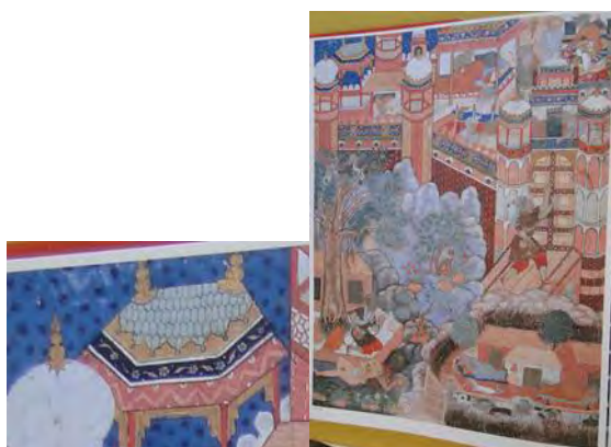
تصویر ۲۲. باسو سر نماد پوش را می‌زند و با گول‌زدن، راه خود را به قصر می‌رسد. یکو باز می‌کند؛ حمزه‌نامه.