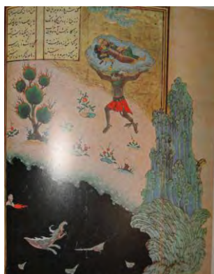
تصویر ۲۴. سمت چپ: اکوان دیو رستم را به دریا می‌افکند؛ شاهنامه محمد جوکی.