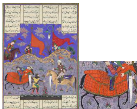
تصویر ۷. رستم اسفندیار را می‌کشد؛ شاهنامه شاه طهماسب.