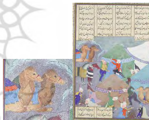
تصویر ۹. دوره ششم اسفندیار: او از میان برف می‌آید؛ شاهنامه شاه طهماسب.