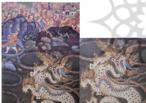
تصویر ۱۲. عمر یک اژدها را با نفت می‌کشد؛ حمزه‌نامه. مأخذ: (Seyller, 2002: 200)

یکی از واژه‌های کهن است و قدمت آن به دوران آریاییان می‌رسد. در اساطیر ایران باستان، دیو نماینده حضور شر و نیروی حافظ پلیدی در جهان است. «این نیروهای شر که دستیاران اهریمن یا انگره مینو به شمار می‌آیند، با نام‌های دیو و دروج از ایشان یاد شده است» (عقیقی، ۱۳۸۳: ۵۲۳). دیو در نگارگری ایران با چهره‌ای ترسناک و وحشتناک که ترکیبی از پیکره انسان با سر، دست، پا و دیگر اعضای بدن