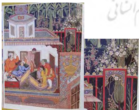
تصویر ۶. جاسوس، ماهوس - خواجه بهبود را وادار کرد تا با جانش به هر روشی قالماس و خرم‌ماه، پسر برادر و دختر قیمار را کمک کند؛ حمزه‌نامه.

اسب نزد ایرانیان بسیار گران‌بها بود و در جایگاه و شکوه قدرت به بارگاه ایزدان راه یافت و خدایان نیز در مواردی برای نشان دادن قدرت خود، به‌صورت اسب درآمدند. «در اوستا، اسب، قوچ و گراز شکل‌های مجسم ایزد مهر، ورثرغنه، معرفی می‌شوند که در نبرد نیکی علیه شر شرکت می‌کنند» (دبلیو، ۱۳۷۴: ۱۵۳). در نگارگری ایرانی در صحنه‌های مربوط به