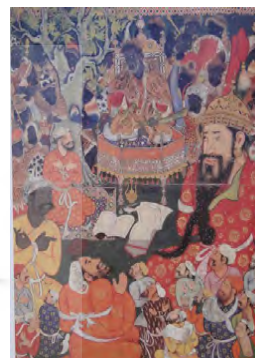
تصویر ۲۵. از طریق ترفند عمر، امیر حمزه، لندهور، عمر معدی کرب و زمره شاه در کنار تخت لاکمان دستگیر شدند؛ حمزه‌نامه.

تشابه در نگاره حمزه نامه و نسخه ای از جامع‌التواریخ