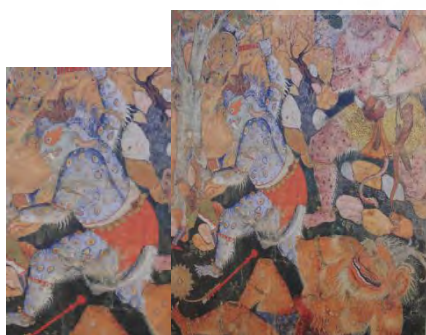
تصویر ۱۴. حمزه با سه دیو می‌جنگد؛ حمزه‌نامه. مأخذ: (Seyller, 2002: 83)

تطبیق اژدها در حمزه‌نامه و شاهنامه شاه طهماسب