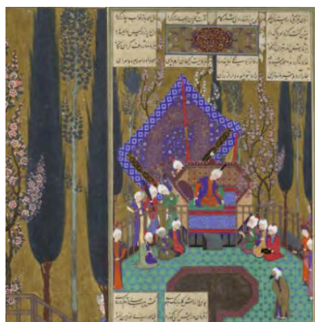
تصویر ۱. زال با مجوسان مشورت می‌کند؛ شاهنامه شاه طهماسب.