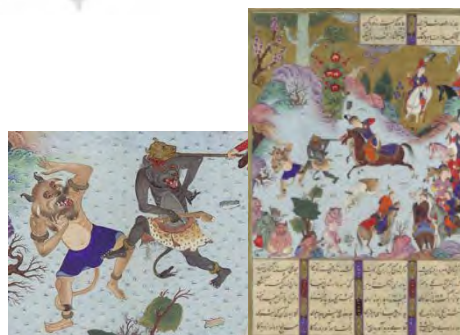
تصویر ۱۳. تهمورث دیوها را شکست می‌دهد؛ شاهنامه شاه طهماسب.

تطبیق دیو در حمزه‌نامه و شاهنامه شاه طهماسب