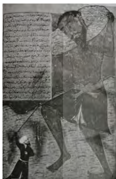
تصویر ۲۶. زدن موسی غول را، صفحه‌ای از جامع‌التواریخ رشیدالدین، مکتب تبریز، اواخر سده هشتم / چهاردهم، سابقاً در تملک طباق. مأخذ: (پوپ، ۱۳۸۴: ۴۱۰)

تشابه در نگاره حمزه نامه و شاهنامه محمد جوکی