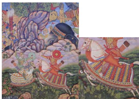
تصویر ۸. بدیع الزمان ایرج را می‌کشد؛ حمزه‌نامه. مأخذ: (Seyller, 2002: 236)