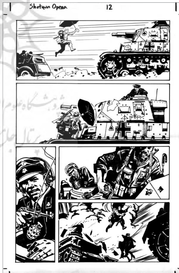
تصویر ۱- گروهان فیوری و کماندوهای خوفناکش در ژانر جنگی کمیک آمریکایی از مجموعه انتشارات مارول.

این در حالی است که در غرب نیز ژانرهایی چون ژانر وسترن، معادلی در ایران ندارد؛ چرا که این ژانر تا حد زیادی بر واقعیت تاریخی متکی است، از شروع قرن بیستم، استریپ‌های روزنامه‌ای، موضوعات و کاراکترهای وسترن را عرضه کردند که مبتنی بر وجود گروه‌هایی از گاوچران‌ها و افراد باغی و مهاجر و قبیله‌های سرخ‌پوست در غرب آمریکا بودند. این کمیک‌ها همچنین بر تصویری که آوازاها، قصه‌های عامه‌پسند و نمایش‌های صحنه‌ای غرب وحشی از پیشگامان غرب نشان می‌دهند، متکی‌اند. اسمیت در مورد گونه‌های سینمایی این ژانر می‌نویسد: «بازیگران اولیه این فیلم‌ها گاهی این آمیزه واقع‌گرایی و اسطوره را بازتاب داده‌اند» (Smith & Duncan, 2009, 199).