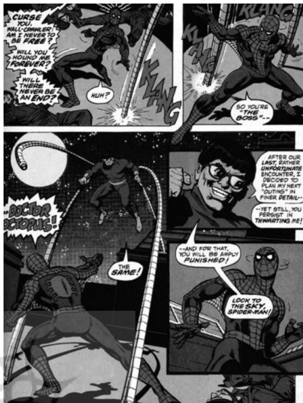
تصویر ۳- اسپایدرمن، استن لی، استیو دیتکو، در مجموعه اسپایدرمن و بتمن از انتشارات مارول در ژانر ابرقهرمانی.