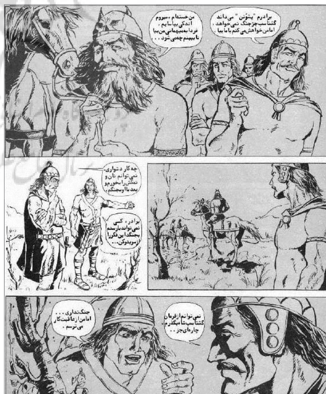
تصویر ۵- مجموعه کمیک رستم و اسفندیار با تصویرگری سیروس راد در ژانر حماسی. مأخذ: (تورهنده، ۱۳۹۰، ۶۹)