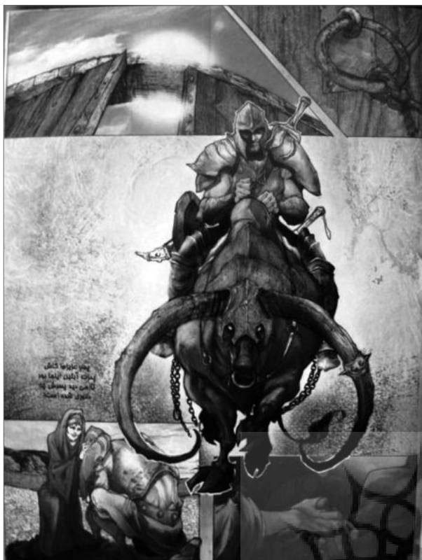
تصویر ۴- کمیک استریپ اژی دهاک در ژانر حماسی از مجموعه علی واعظی. مأخذ: (واعظی، ۱۳۸۹، ۶۹)