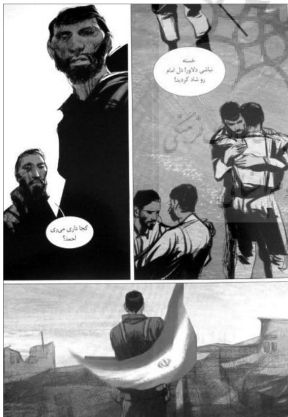
تصویر ۲- کتاب کمیک خط اول، داستان‌های دفاع مقدس در ژانر جنگی، از مجموعه حسن روح الامینی. مأخذ: (روح الامینی، برزا، مفوز، ۱۳۹۰، ۳۵)

از سوی دیگر ژانر علمی تخیلی نیز که ژانر گسترده‌ای است که در بسیاری از رسانه‌های پر مخاطب است، در ایران معادلی ندارد. این ژانر «همیشه درگیر تعمق درباره علم و تکنولوژی واقعی است. داستان‌های این ژانر خود را سرگرم درگیری بین ایده‌ها و اعتقادات انسانی و مفاهیم بیگانه‌ای کردند که در آنها موجودات اشرافی فضایی، زنان جوان را از چنگال غول‌های چشم قورباغه‌ای نجات می‌دادند» (ریچاردسون، ۱۳۷۳، ۴۴). با این تفاسیر، پیشینه هر دو ژانر نامبرده به جغرافیا، فرهنگ و دست‌آوردهای جهان غرب باز می‌گردد و کاملاً طبیعی است که نمودی در کمیک‌های ایرانی نداشته باشند. چنانچه متقابلاً ژانر مذهبی و عامیانه در ایران نیز همین ویژگی را دارد. ژانر مذهبی در ایران برآمده از عقاید و اهمیت امور دینی نزد ما است، که ممکن است ارزش‌های مذهبی چنین کیفیت حیاتی و تعیین‌کننده‌ای را در جهان غرب نداشته باشند. بنابراین عقاید مذهبی به روشنی در تصویرگری و داستان‌پردازی این ژانر قابل پی‌گیری است و بدیهی است که نمونه آن در کمیک‌های غربی یافت نمی‌شود. از سوی دیگر مناسبات موضوعی ژانر عامیانه بر یک فرهنگ بومی - مختص به یک محدوده جغرافیایی خاص - متکی است، بنابراین علت عدم وجود چنین ژانری در فرهنگ تصویرگری غرب بدیهی است. به نظر می‌رسد ژانرهای مشترک در کمیک ایرانی و غربی، عموماً ژانرهایی هستند که