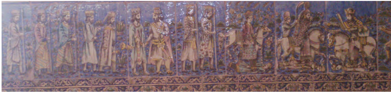
تصویر ۱۳- کاشی نقش برجسته تالار اصلی کاخ گلستان ، نمای کلی از نقش برجسته هخامنشی و ساسانی.

جدول ۱- جامعه آماری کاشی های نقش برجسته تالار اصلی کاخ گلستان به ترتیب زمانی.