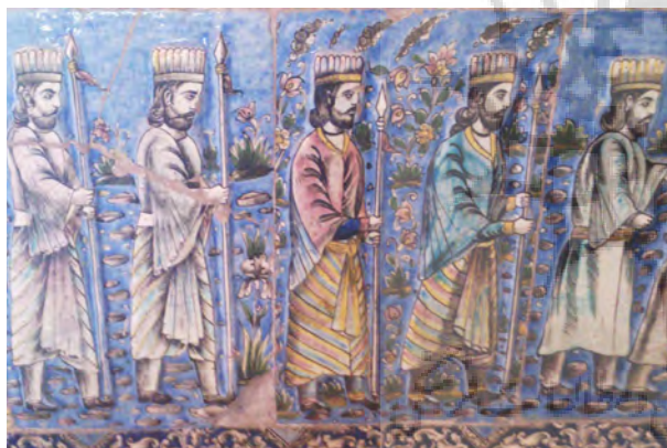
تصویر ۱۱- کاشی نقش برجسته تالار اصلی کاخ گلستان با تصویرسربازان هخامنشی.

توجه به مظاهر فرهنگ و تمدن ایران باستان، رویکرد سیاسی دولت قاجار را تشکیل می‌دهد و تجلی این رویکرد در آثار هنری دوران قاجار به خوبی مشهود است. در حقیقت، تاکید هنر قاجار بر موضوعات مرسوم در هنر ایران باستان، به منظور برابر نهادن اقتدار سیاسی شاهان قاجار با اقتدار سیاسی شاهان باستانی ایران مشروعیت بخشیدن به قدرت حاکم بوده است (آزند، ۱۳۸۵، ۴۱). تلاش‌های متوالی برای مشروعیت بخشیدن به زمان حال از طریق بازسازی هدفمند تاریخ گذشته بارها پایه مشروعیت سلسله‌های حاکم بر ایران قرار گرفته و از پدیده‌های متداول تاریخ این سرزمین محسوب می‌گردد (Bausani, 81, 1977). یک نمونه کاشی نقش برجسته که از دیوارنگاره‌های پلکان شرقی تخت جمشید و همچنین نقش برجسته گرفتن حلقه پادشاهی توسط اردشیر بابکان از هورامزدا در نقش رستم شیراز الگو برداری شده است (تصاویر ۱۱ و ۱۲). قابل ذکر است که شاهان قاجار برای افزایش دامنه تأثیر این آثار، آنها را در جاهایی حکاکی کرده‌اند که یادآور گذشته باستانی ایران، باورهای عامه، یا سنت‌های مذهبی باشد (Lerner, 1991, 33).