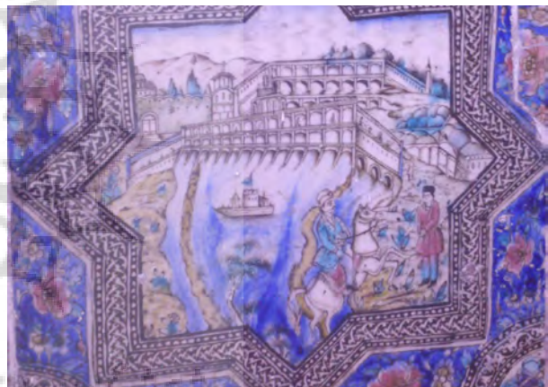
تصویر ۵- کاشی نقش برجسته منظره پل بر روی رودخانه در اروپا، سرسرای تالار اصلی کاخ گلستان.

از موضوعات مورد علاقه هنرمندان ایرانی، تصویرسازی مضامین برگرفته از داستان‌های ادبی از جمله، داستان بهرام گور می‌باشد. در این تصاویر، بهرام سوار بر اسب، در حال شکار آهو به همراه کنیزش، آزاده چنگ نواز به چشم می‌خورد (تصویر ۶).