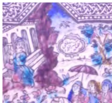
تصویر ۱- کاشی نقش برجسته، سرسرای تالار اصلی کاخ گلستان، با امضا و عمل مصطفی ۱۳۰۴.

با گسترش روابط خارجی و ورود هرچه بیشتر نقاشی‌ها، باسمه‌ها، کارت پستال‌ها و دیگر مصنوعات منقوش اروپایی، توجه