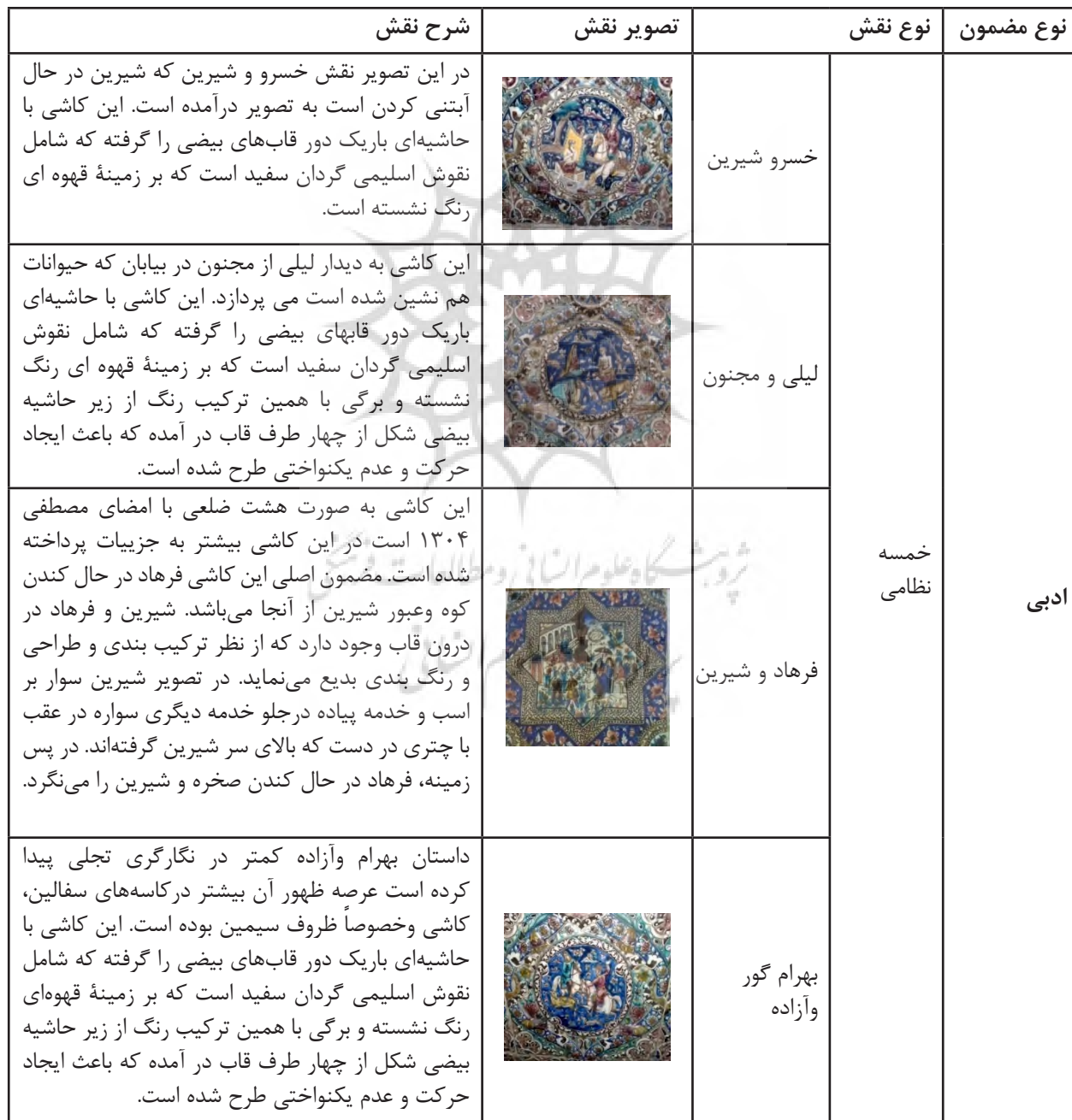
جدول ۲- ویژگی تصاویر کاشی های نقش برجسته سرسرای تالار اصلی کاخ گلستان بر اساس مضامین.