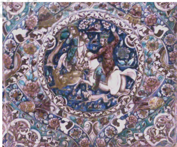
تصویر ۶- کاشی نقش برجسته بهرام گور به همراه آزاده در حال شکار آهو، سرسرای تالار اصلی کاخ گلستان.