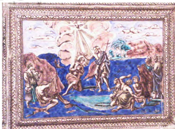
تصویر ۱۰- کاشی نقش برجسته تعمید عیسی (ع) بدست یحیی، سرسرای تالار اصلی کاخ گلستان.