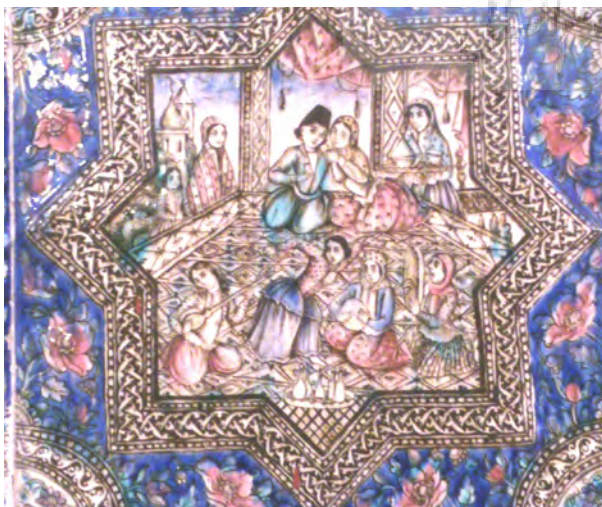
تصویر ۸- کاشی نقش برجسته تصویر بزمی از دوره قاجار، سرسرای تالار اصلی کاخ گلستان.