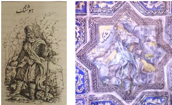
تصویر ۳- راست: کاشی نقش برجسته با تصویر هوشنگ و متن روی کاشی «پیشدادیان، هوشنگ، جلوسش قبل از میلاد ۳۲۴۶، سلطنتش ۴۰ سال». چپ: تصویر چاپ سنگی هوشنگ از کتاب نامه خسروان اثر جلال‌الدین میرزا.

دیگران، ۱۳۸۱، ۳۰). نکته مهم در تقلید و تلاش برای احیای مجالس و نقش برجسته‌های پیش از اسلام است (کاربونی و ماسویا، ۱۳۸۱، ۵۱). با بررسی این کاشی‌ها، تصاویر شاهان باستانی از هوشنگ تا خشایار، شاپور اول، شاه عباس، نادر، فتحعلی شاه و مشاهیر ایران مشاهده می‌شود. یکی از کاشی‌ها، تصویر هوشنگ در هیئت پیری با محاسن سپید نشسته بر تختی را نشان می‌دهد (تصویر ۳ راست) که با الگوبرداری از نقاشی‌های چاپ سنگی انجام شده است. در آن عصر، هنرمندان کاشی‌پز از کتاب نامه خسروان ۵ نوشته جلال‌الدین میرزا پسر فتحعلی شاه برای صورت بخشیدن به قهرمانان فراموش شده تاریخ ایران بهره می‌بردند (ذکاء، ۱۳۴۱، ۲۴) (تصویر ۳ چپ). توجه به برخی مشاهیر سیاسی از دیگر مضامین به کار رفته در این کاشی‌ها می‌باشد. در این کاشی‌ها، برخی شخصیت‌های مشهور تاریخ قاجار مانند امیر کبیر در زمینه سیاست به صورت انفرادی و گروهی تصویرسازی شده‌اند (تصویر ۴).