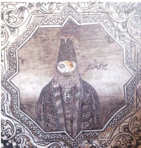
تصویر ۴- کاشی نقش برجسته با تصویر امیر کبیر، سرسرای تالار اصلی کاخ گلستان.

بسیاری از هنرمندان به نقوش طبیعت‌گرایانه اروپایی جلب شده و جنبش فرنگی‌سازی که از دوران صفویه آغاز شده بود، بیش از پیش گسترش یافت (نوایی، ۱۳۸۲، ۱۳). در این دوره، با الگو گرفتن از باسمه‌های وارداتی، مناظر و چهره پردازی‌های کم ارزش اروپایی بر روی کاشی‌ها انجام شده است (فلور و همکاران، ۱۳۸۱، ۲۰-۲۶). از عوامل موثر بر جنبش تصویرگری، پیدایش عکس و صنعت عکاسی در ایران است، که موجب شد موضوعات تازه‌ای وارد هنرهای تصویری آن زمان شود (تناولی، ۱۳۶۸، ۱۲). تأثیرپذیری از شاهنامه فردوسی و ایجاد یک حس ملی‌گرایی و تمایل به تقلید از نقوش ایران باستان، تأثیرپذیری از داستان‌های ادبی مانند خمسه نظامی، منطق الطیر عطار، جامی، تأثیرپذیری از عکاسی و عکس و چاپ سنگی، الگوگیری از نقش برجسته‌های باقی‌مانده از دوره‌های پیشین، الگوبرداری از آثار و تصاویر وارداتی و تقلید از شیوه کار نقاشان ایرانی آموزش دیده بر اساس اصول نقاشی غرب را از مهم‌ترین عوامل موثر بر روند تصویرگری کاشی‌های نقش برجسته قاجار می‌باشد.