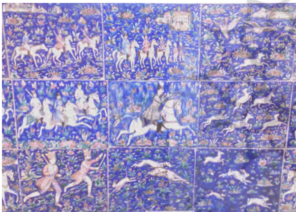
تصویر ۷- کاشی نقش برجسته با تصویر ناصرالدین‌شاه در حال شکار، سرسرای تالار اصلی کاخ گلستان.

تصویرپردازی از مجالس بزمی که در آن عده‌ای خنیاگر به نوازندگی و دست افشانی مشغول هستند، جزء بی بدیل موضوعات این کاشی‌ها است. در صدر مضامین بزمی این کاشی‌ها، مجالس داستان‌های تغزلی همچون لیلی و مجنون، فرهاد و شیرین، بهرام و گلندام، شیخ صنعان و دختر ترسا و بالاتر از همه صحنه‌های شکار و تفریح و تفنن قرار دارد (تصویر ۸).