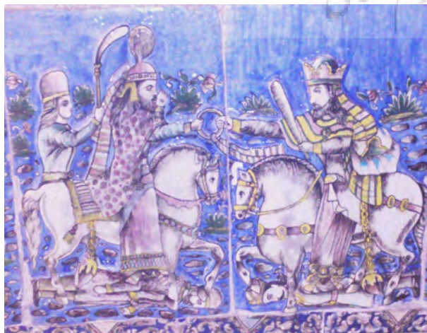
تصویر ۱۲- کاشی نقش برجسته تالار اصلی کاخ گلستان با تصویر گرفتن حلقه پادشاهی توسط اردشیر از هورامزدا.