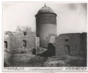
تصویر ۲- راست: کاشی نقش برجسته، تالار اصلی کاخ گلستان مقبره پیر علمدار در دامغان.