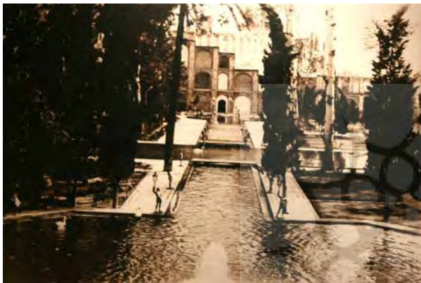
تصویر ۱۴- تزیین باغچه و حوض منتهی به تکیه دولت با مجسمه‌ها به شکل پایه چراغ.

شخص می‌توانست سه روز نشسته آن را تماشا کند. هر پرده صورت و هر مجسمه و هر اطاق را ده روز دیدن کفایت نمی‌کرد» (ناصرالدین شاه، ۱۳۴۳، ۳۰-۳۱).