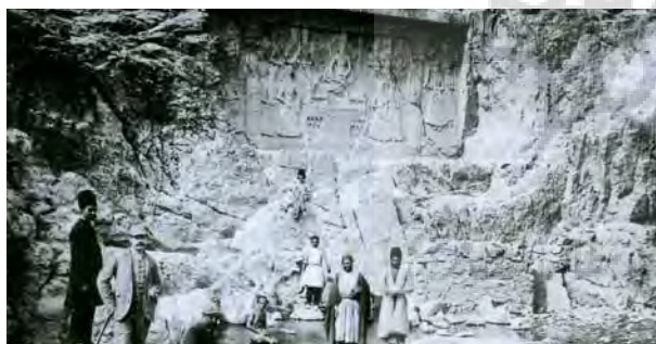
تصویر ۹- نقش برجسته فتحعلیشاه در جمع شاهزادگان و درباریان، چشمه علی شهر ری.

ستون تشکیل گردیده، شاه با لباس معمولی است و قوشی را به روی مچ دست گرفته است. بدون شک این منظره یادبودی از شکارهایش که در دشت ری می کرده می باشد... مسافرینی که پیش از مابدینجا آمده نقل کرده اند در همین مکان یک قسمت حجاری از دوره ساسانیان به دست آورده اند که از قرار معلوم فتحعلیشاه او را نابود ساخته و به جایش از خود یادگاری نقش نموده است. خیلی تعجب است! چرا این پادشاه که صنایع را بسیار دوست می داشت پاس احترام این حجاری راندانسته و تصویرش را در جای دیگر نقش نموده است؟! «(فلاندن، ۱۳۵۶، ۱۱۳-۱۱۴).