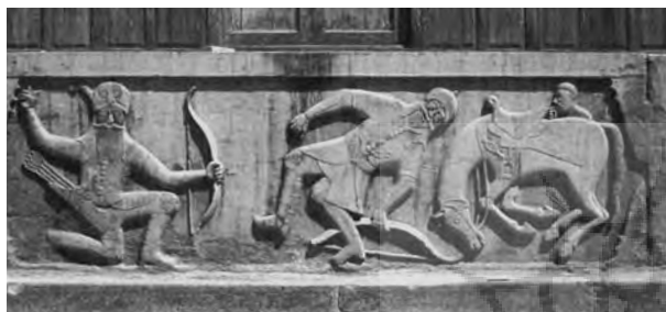
تصویر ۸- نقش برجسته نبرد رستم و اسفندیار، دیوان خانه کریم خان زند، شیراز، سده دوازدهم ه. ق.