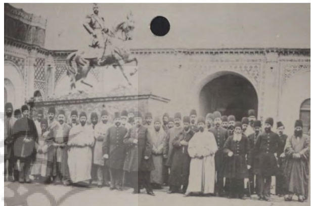
تصویر ۱۸- بازدید از مجسمه همایونی در قورخانه، ۱۳۰۴ ه.ق.، از عکس‌های دوره ناصری در آرشیو کاخ گلستان.

می‌شود، از جمله در این اوقات بر حسب دستورالعمل جناب اقبال السلطنه وزیر قورخانه مبارکه مجسمه از تمثال بی مثال بندگان اقدس همایون شاهنشاهی تقریباً به اندازه جسم و هیكل مقدس مبارک سواره با لباس رسمی ساخته و ریخته‌اند که از حیث صنعت ریخته‌گری و علم نقاشی و تناسب اعضا و دقایق اوستادی در این فن مخصوص مجسمه سازی بهتر از آن به تصور نمی‌آید، مانند کارهای خوب اساتید اروپا است و حال آنکه اوستادان و صنعتگران این مجسمه تماماً ایرانی هستند. چند روز قبل که بندگان اعلیحضرت اقدس همایون شهریار خلدالله ملکه تشریف فرمای قورخانه مبارکه شدند و نواب مستطاب والا نایب السلطنه امیر کبیر وزیر جنگ و جمعی دیگر از وزراء عظام و امراء نظام و غیرهم ملتزم رکاب اعلی بودند، این مجسمه مبارکه بلحاظ نظر آفتاب اثر همایون رسیده زیاده از حد مورد تحسین و تمجید افتاد و موجب حیرت تمام ناظرین گردید، نخست نواب مستطاب والا شاهنشاه زاده معظم وزیر جنگ نظر به ترقیات کلیه اعمال قورخانه مبارکه مشمول مراسم خاصه ملوکانه شده، سپس جناب اقبال السلطنه وزیر قورخانه و همچنین هر یک از اساتید و صنعتگران این مجسمه مورد التفات و تحسین زیاد افتادند و مقرر آمد که در باره هر یک از آنها بر حسب رتبت و صنعت از طرف دولت، محض تشویق خاطر آنها بذل امتیاز و مرحمتی بشود. پس از آن بندگان همایون مقرر فرمودند که این مجسمه مبارکه را در جای