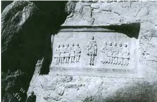
تصویر ۱۳- نقش برجسته ناصرالدین شاه و ده تن از وزرا و خواص، حجاری شده در کوه هراز، دهه ۱۳۰۰ ه. ق.