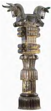
تصویر ۲- بخشی از ستون کاخ آپادانا در تخت جمشید، موزه ایران باستان تهران. ماخذ: (Nigel and Curtis, 2005, 64)