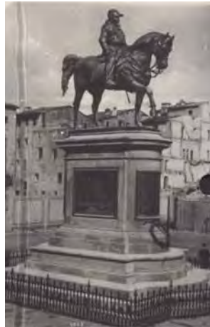
تصویر ۱۷- طراحی از مجسمه همایونی، کار ابوتراب غفاری، ۱۳۰۴ ه.ق.

مجسمه همایونی سرآغازی برای مجسمه سازی نوین در ایران و به فراموشی سپردن شیوه‌های سنتی حجم پردازی نیمه برجسته بوده است. پس از مجسمه همایونی است که مجسمه سازی به شیوه اروپایی با شروع به کار کردن مدرسه صنایع مستظرفه در ایران تعلیم داده شد و نسل جدیدی از مجسمه سازان همچون ابوالحسن صدیقی که از آن مدرسه فارغ التحصیل شد، پرورش یافتند. به این ترتیب مجسمه سازی طبیعت‌گرای ایران از چنین حرکتی در دوره ناصری شروع شد و پا به پای نقاشی طبیعت‌گرا که از همان دوران آغاز شده و با کمال‌الملک و شاگردان او رسمیت یافته بود جای خود را در هنر و جامعه ایرانی گشود. گسترش پایتخت و توسعه شهرها بر اساس الگوهای توسعه غربی که با تقلید از معماری اروپایی در دوره قاجار رونق یافته بود به همراه خود بهره‌گیری از مجسمه را در فضای شهری رایج کرد. این روند در دوره پهلوی گسترش یافت و تا اواسط دوره پهلوی تنها شیوه مسلط در هنر تجسمی ایران به شمار می‌آمد. با شروع اصلاحات نوگرایانه و نوجویانه در جامعه و هنر ایران از دهه ۱۳۲۰ تحت تأثیرات مدرنیسم، مجسمه سازی ایران نیز تحولات نوگرایانه را تجربه کرد.