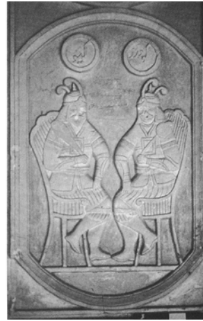
تصویر ۱۱- مجلس گیو و گودرز، گچ‌بری به صورت نقش برجسته، قلعه طاهری، اواخر دوره قاجار. ماخذ: (هیلن براند، ۱۳۸۸، ۲۷۶)

پولاک که به مدت نه سال در ایران بوده و پنج سال از این مدت را به عنوان پزشک ناصرالدین شاه خدمت کرده است، وقتی درباره وضعیت نقاشی دربار ناصرالدین شاه صحبت می‌کند، راجع به الگوبرداری از مجسمه‌های نیم تنه نیکلای اول برای بالا تنه شاه می‌نویسد: «وی [ناصرالدین شاه] یک نفر را با سمت "نقاش باشی" در خدمت دارد که