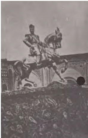
تصویر ۱۶- عکس مجسمه همایونی که در قورخانه تهران ساخته شد، از عکس‌های دوره ناصری در آرشیو کاخ گلستان.