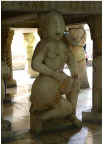
تصویر ۱۰- یکی از پایه‌های تخت مرمر به شکل دیو، اثر استاد محمد ابراهیم حجّار اصفهانی، کاخ گلستان، دوره قاجار.

که فتحعلی شاه در هنر این دوران هموار کرد و علاوه بر مجسمه‌سازی و حجاری در نقاشی نیز کاملاً هویداست، توانست تا اواخر دوران قاجار و حتی اوایل دوره پهلوی الهام بخش هنرمندان نقاش، معمار، حجار و مجسمه‌ساز باشد. نمونه‌های مختلفی از انتشار سبک قاجار که در تهران به اوج خود رسید، توانست در شهرستان‌ها نیز اشاعه یابد. به عبارت دیگر مکتب هنری تهران در دوره قاجار به عنوان مکتبی ملی در همه ایران تسری یافت. نمونه‌های نقش برجسته و حجاری و گچ بری پایتخت در کوشک‌ها و خانه‌های اعیان و حکمرانان دیگر مناطق بر اساس الگوی قاجاری اشاعه پیدا کرد. یک نمونه شاخص آن را می‌توان در گچ بری‌های تصویری قلعه‌ای در بندر طاهری (سیراف)، در حاشیه خلیج فارس یافت. این نقش برجسته‌های گچی در اواخر دوره قاجار در فاصله سال‌های ۱۳۳۲ تا ۱۳۳۶ ه.ق. در هیجده صحنه ساخته شده‌اند (تصویر ۱۱).