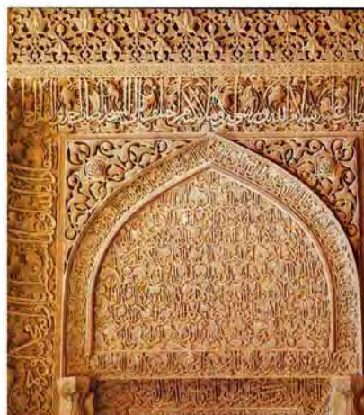
تصویر ۶- تزیینات گیاهی و خوشنویسی حجم دار و برجسته محراب مسجد جمعه اصفهان، ۵۷۱۰ ق.

در مجموع پیشینه تاریخی حجم پردازی و تندیس سازی در سرزمین ایران بیش از هر چیز تاکید بر اصالت و گرایش به نقش برجسته سازی همراه با ساده سازی، تزیین و روایت گری دارد. این ویژگی‌ها و تکرار آن به انحاء مختلف در دوران اسلامی در اندازه کوچک‌تر و کاربردی، به ویژه در دوره قاجار، نشان دهنده علاقه هنرمندان و سفارش دهندگان آثار حجمی به سرشت حجم پردازی ایرانی به صورت نیمه برجسته است.