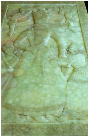
تصویر ۱۲- سنگ قبر فتحعلیشاه، کار محمد حسین حجّار باشی، طرح از عبدالله، موزه قم، ۲۳۹×۱۳۲×۱۳ سانتی‌متر. ماخذ: (تناولی، ۱۳۸۸، ۱۱۱)

که از سواری مراجعت می‌فرمودند. به حاجی ابوالحسن معمار فرمودند در تخته سنگی که مشرف به عمارت است از طرف مشرق، صورت پادشاه را سواره بسازد و صورت امین السلطان. چون حکیم طولوزان هم بوده است صورت او را هم فرمودند بسازد و صورت ملیجک. مقصود از صورت امین السلطان و حکیم طولوزان ملیجک بود. فی الواقع اینها به طفیل او صورتشان ساخته خواهد شد. انشاءالله بعد از اتمام این صورت با اشخاصی که در این سنگ شهرستانک نقاری شد، با اشخاصی که در تنگه واش فیروزکوه در زمان فتحعلی شاه نقش کرده‌اند، تناسب خواهیم داد که از این تناسب وضع آن وقت دولت ایران با حالا معلوم خواهد شد، و بالله توفیق» (اعتمادالسلطنه، ۱۳۷۷، ۱۰۳).