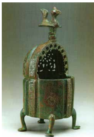
تصویر ۵- بخوردان مشبک، دوره سلجوقی، انستیتو هنر شهر دیترویت امریکا. ماخذ: (محمد پناه، ۱۳۸۸، ج ۲، ۱۰۷)

حجمی و به کار گرفتن نقوش برجسته انسانی و حیوانی در بناها مورد توجه قرار نگرفت اما در قالب شکل دهی به اسباب و آلات کاربردی و سپس تزیینات حجم دار معماری، ذوق حجم پردازانه ایرانیان را به نمایش گذاشت.