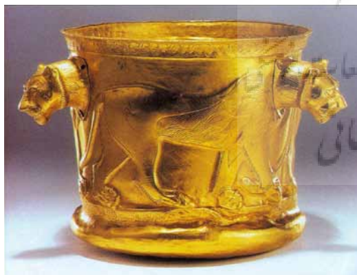
تصویر ۱- جام زرین کلاردشت با نقش شیر، حدود ۹۰۰ ق.م. تپه مارلیک گیلان، موزه لور. ماخذ: (محمد پناه، ۱۳۸۸، ج ۱، ۲۱۰)

در لرستان بخش عمده‌ای از مصنوعات فلزی از آهن و مفرغ از قبیل دهنهٔ اسب، درفش، جنگ‌افزار، سنجاق و آئینه در قالب پیکره‌های آدم، حیوان، جانوران و موجودات اساطیری و شکل‌های گیاهی ساخته شده‌اند. در دورهٔ هخامنشیان نیز تزئین کاخ‌های آپادانا و تخت جمشید با نقش برجسته‌هایی از سنگ معمولاً درباریان، ملازمان، پادشاه و افراد ملل مختلف را نشان می‌دهد. علاوه بر این، مجسمه‌های عظیمی از حیوانات ترکیبی بر دروازه‌های تخت جمشید و سرستون‌های آن وجود دارد که حکایت از ظرافت کار و مهارت فوق‌العادهٔ هنرمندان سنگ‌تراش