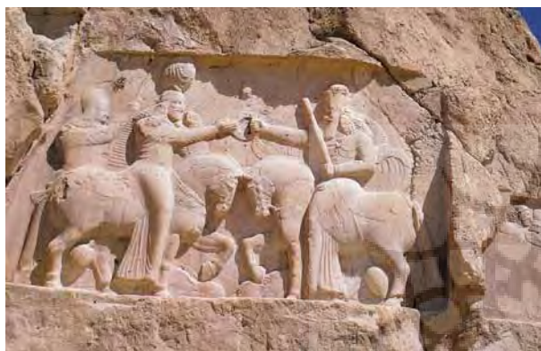
تصویر ۳- نقش برجسته تاج بخشی اردشیر اول، نقش رستم در فارس، دوره ساسانی.