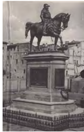
تصویر ۱۵- مجسمه امانوئل دوم سوار بر اسب، از عکس‌های دوره ناصری در آرشیو کاخ گلستان.