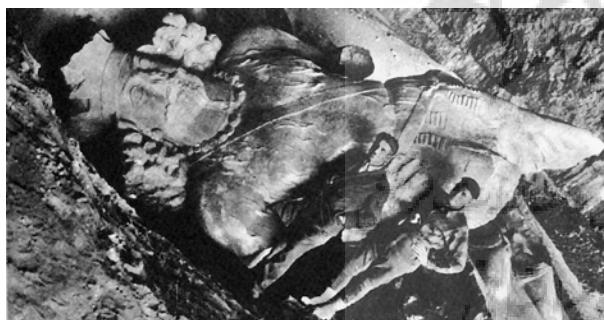
تصویر ۴- مجسمه شاپور اول روی زمین، عکس مربوط به دهه ۱۹۲۰، دوره ساسانی.