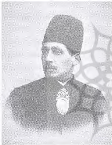
تصویر ۶- عکس وزیر همایون اثر عبدا... میرزای قاجار و تصویر قلمی چاپ سنگی از روی آن در روزنامه شرافت شماره ۳۹.