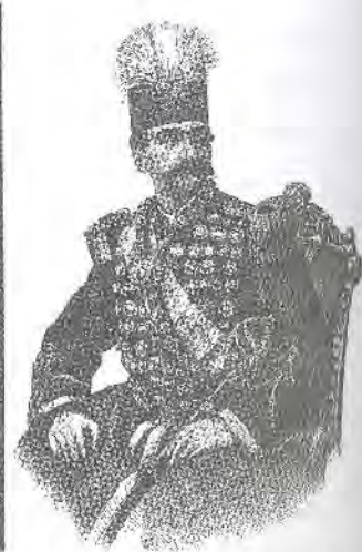
تصویر ۱- عکس ناصرالدین شاه و تصویر قلمی چاپ سنگی از روی آن در روزنامه شرف شماره ۱، ماخذ: (کاخ گلستان، آلبوم ۱، ۵۰)