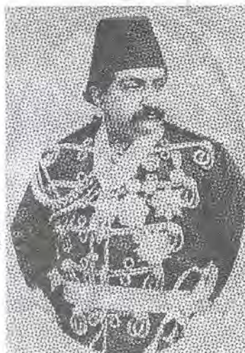
تصویر ۲- عکس ظل السلطان اثر میرزا احمد صنیع السلطنه و تصویر قلمی چاپ سنگی از روی آن در روزنامه شرف شماره ۲