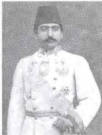
تصویر ۴- عکس کامران میرزا اثر آقارضا عکاس باشی (اقبال السلطنه) و تصویر قلمی چاپ سنگی از روی آن در روزنامه شرف شماره ۴.