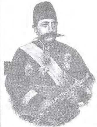
تصویر ۵- عکس مظفرالدین میرزا (ولیعهد) اثر منوچهرخان عکاس باشی و تصویر قلمی چاپ سنگی از روی آن در روزنامه شرف شماره ۱۶۶۲.

نقش "بته جقه" با ابعاد بزرگتر، مشکل را برطرف نموده است.