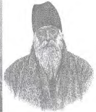
تصویر ۳- عکس میرزا یوسف اثر میرزا احمد صنیع السلطنه و تصویر قلمی چاپ سنگی از روی آن در روزنامه شرف شماره ۲.